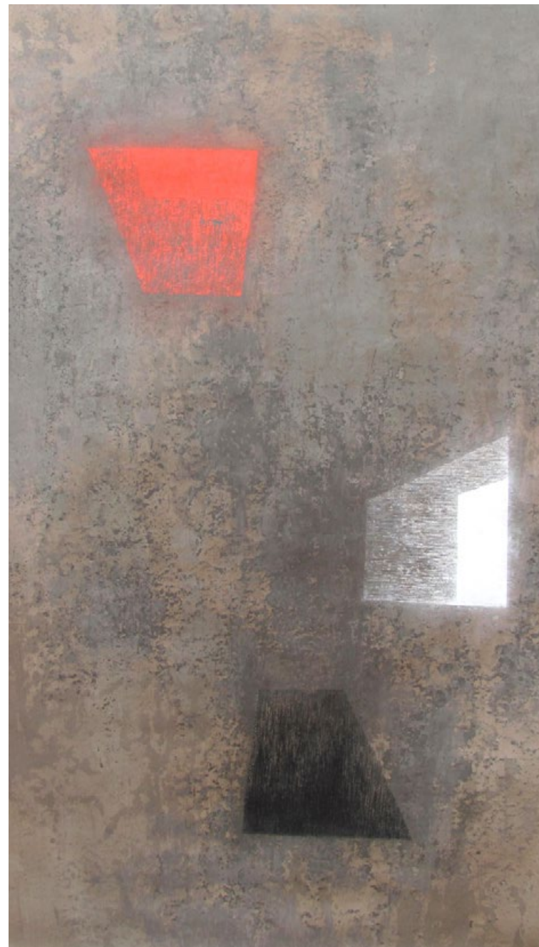
Tři prúduchy I, z cyklu Opus magnum, 2003–8, akryl a popel na papíře, 230 x 130 cm