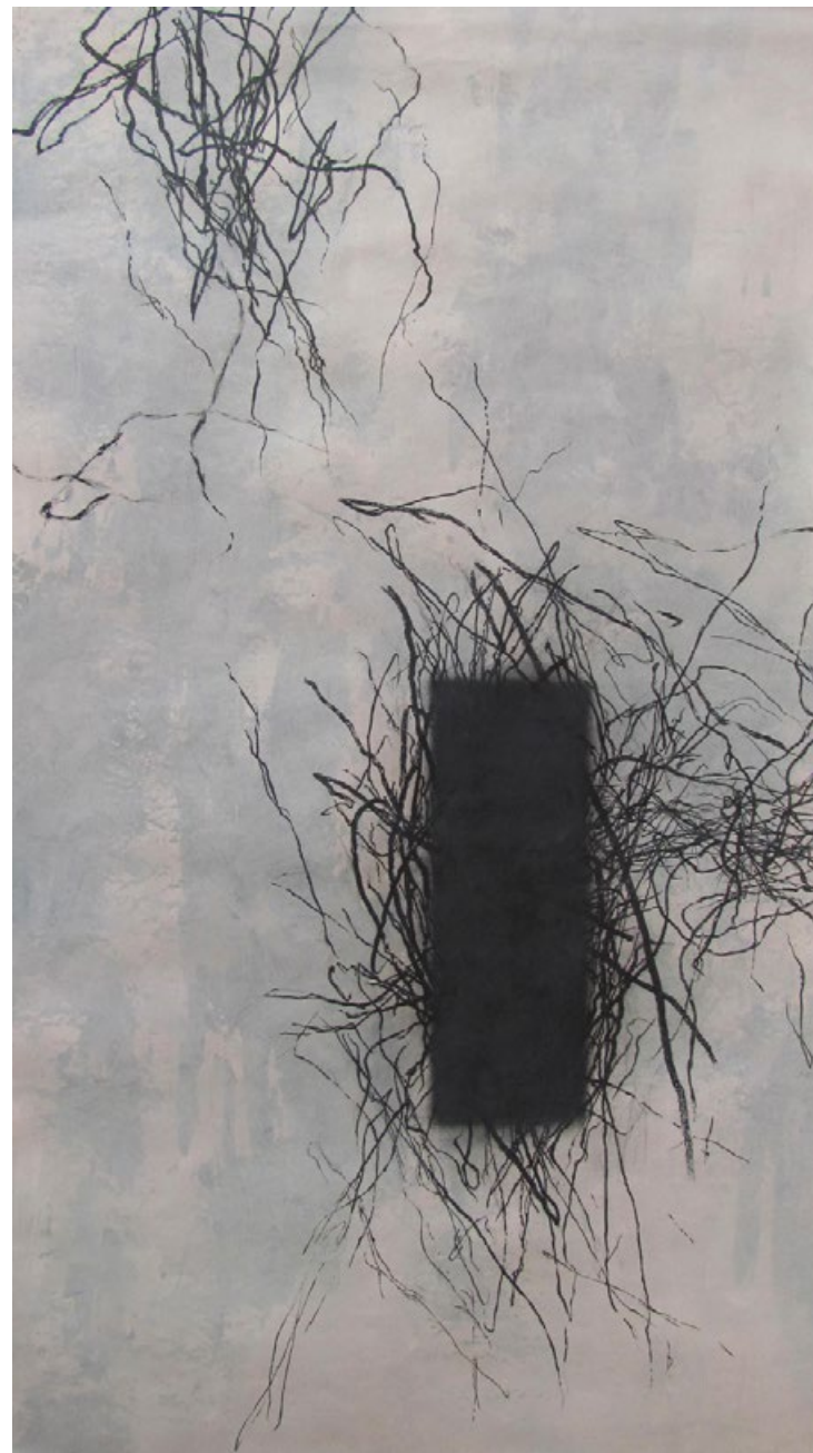
Nigredo, z cyklu Opus magnum, 2003–8, akryl a popel na papíře, 230 x 130 cm (Černota, temná noc duše)