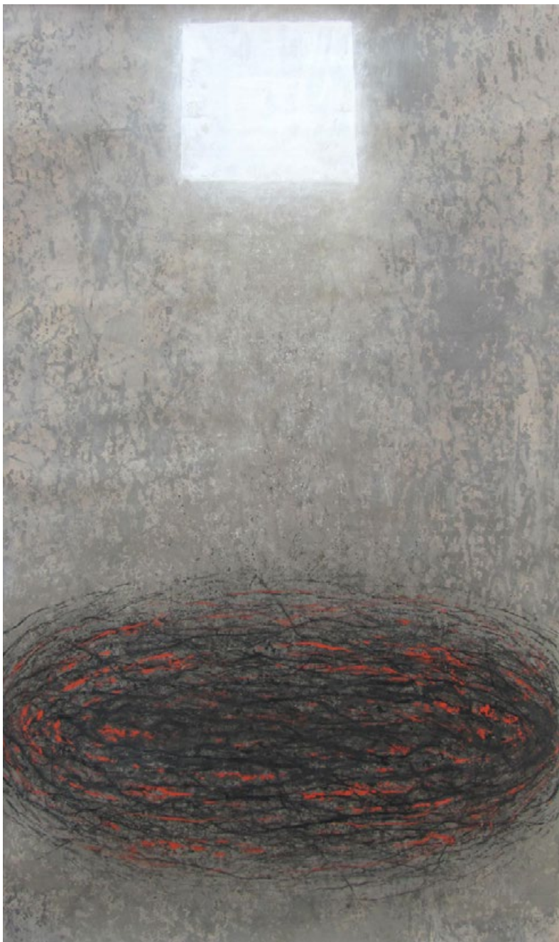
Po temnotách světlo, z cyklu Opus magnum, 2003–8, akryl a popel na papíře, 230 x 130 cm