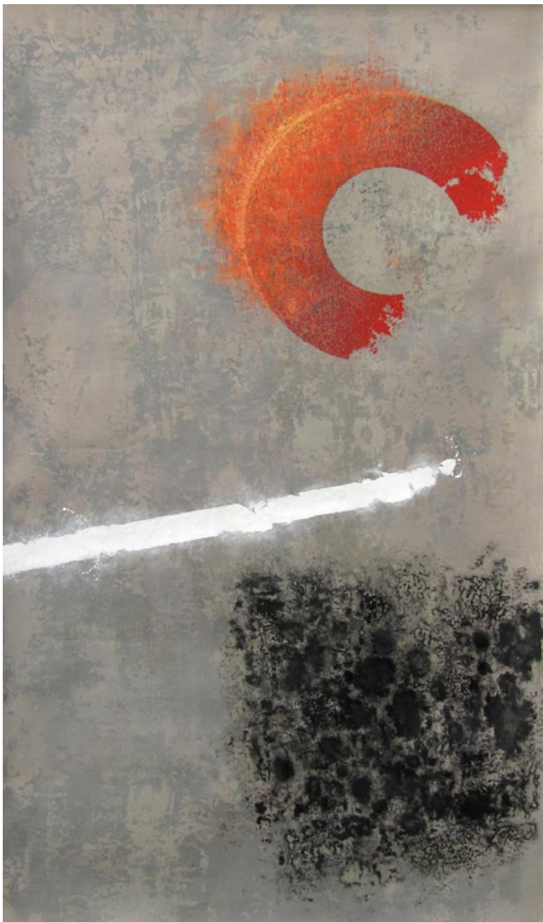
Na prahu ohně, z cyklu Opus magnum, 2003–8, akryl a popel na papíře, 230 x 135 cm