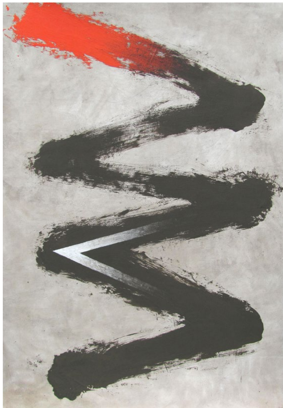
Proměna, popel a akryl na papíře, 100 x 70 cm