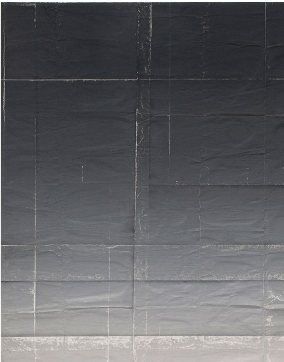
Bez názvu (Papír 0046), 2016, olej na papíře na plátně, 65 x 50 cm