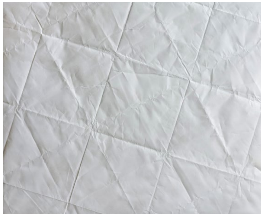
Bez názvu 2018, sprej a papír na plátně, 100 x 120 cm