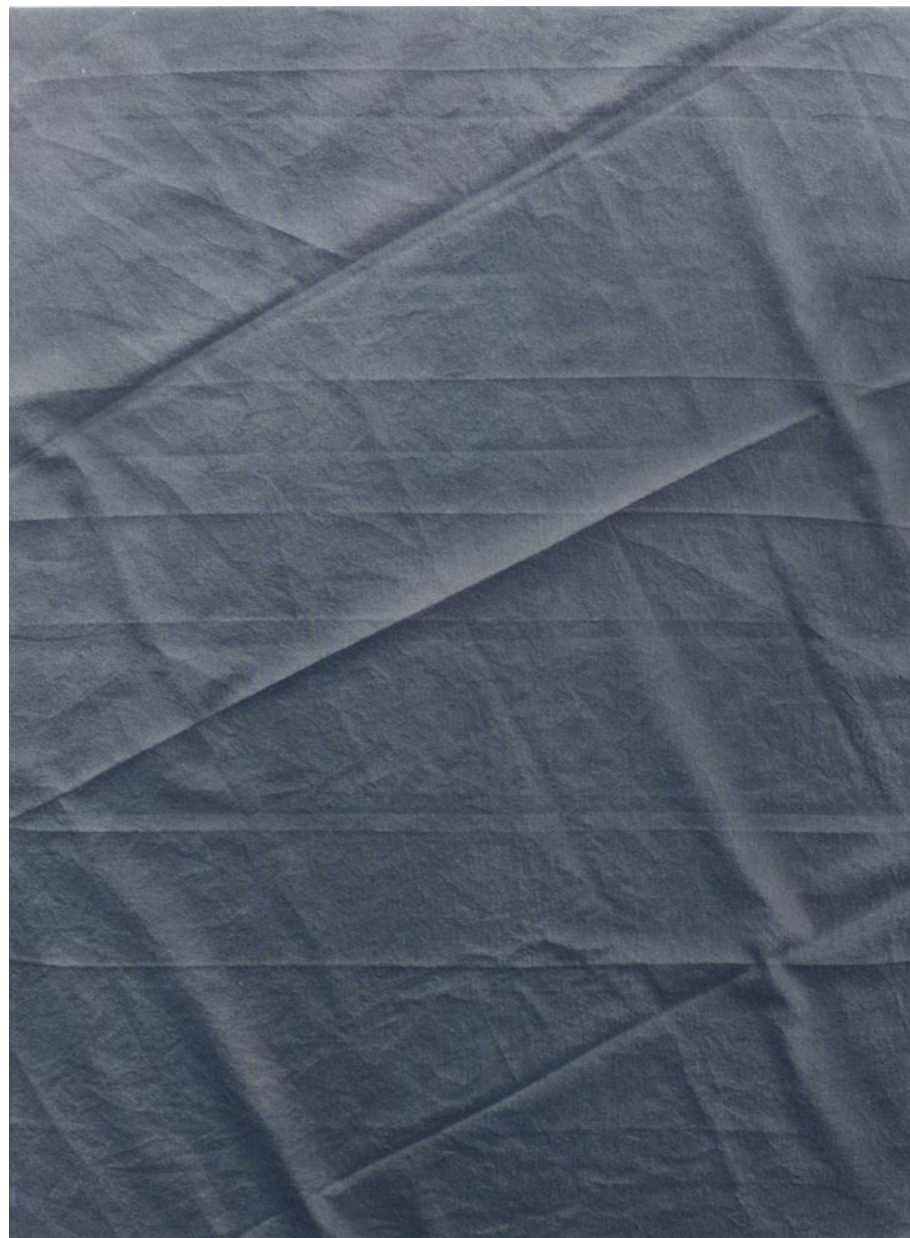
Ozvěny fragility, 2020, akryl na plátně, 80 x 60 cm