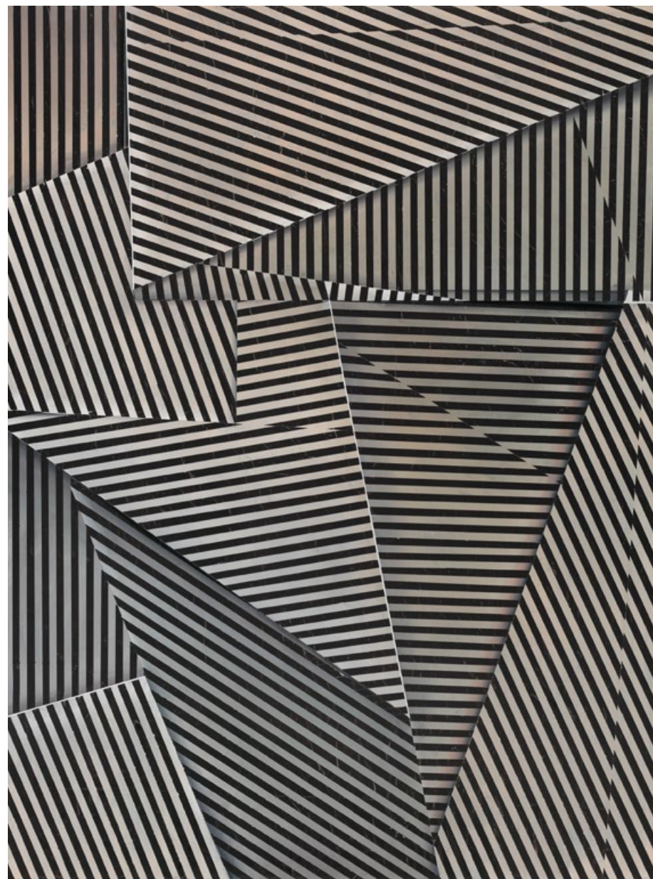
Rozbitý tvar M, 2015, olej, olejový pastel a papír na plátně, 120 x 90 cm