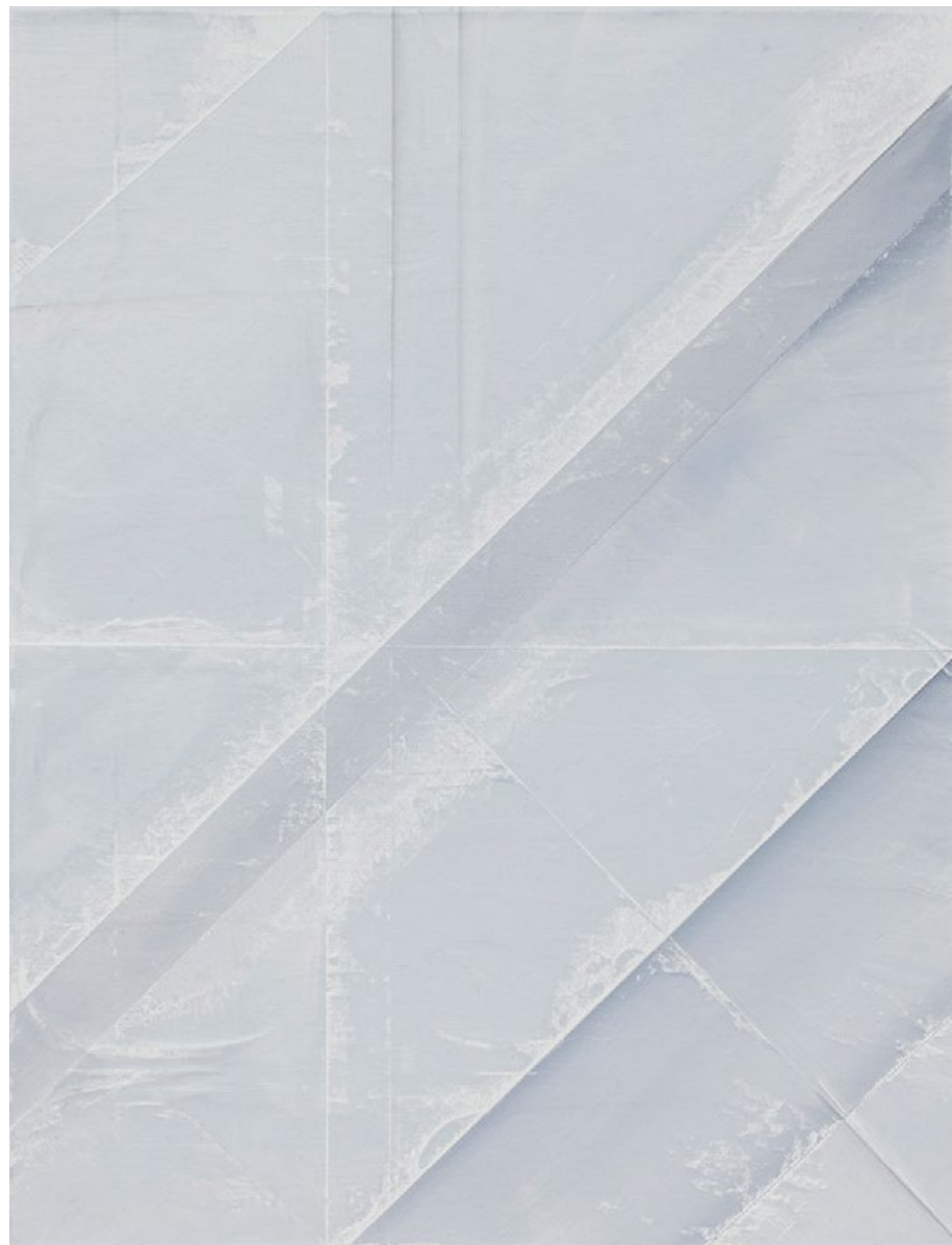
Bez názvu (Papír 0045), 2016, olej na papíře a na plátně, 65 x 50 cm