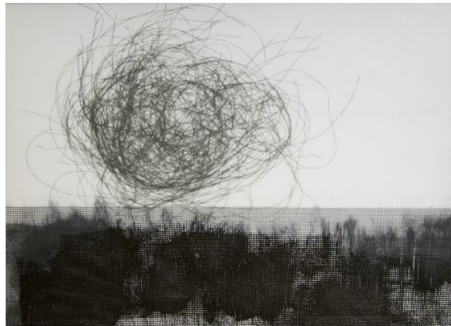
Laskavec, 2020, syntetická barva na sklo, sklovlákno, leptané sklo, dřevěný rám, 32 x 43 cm