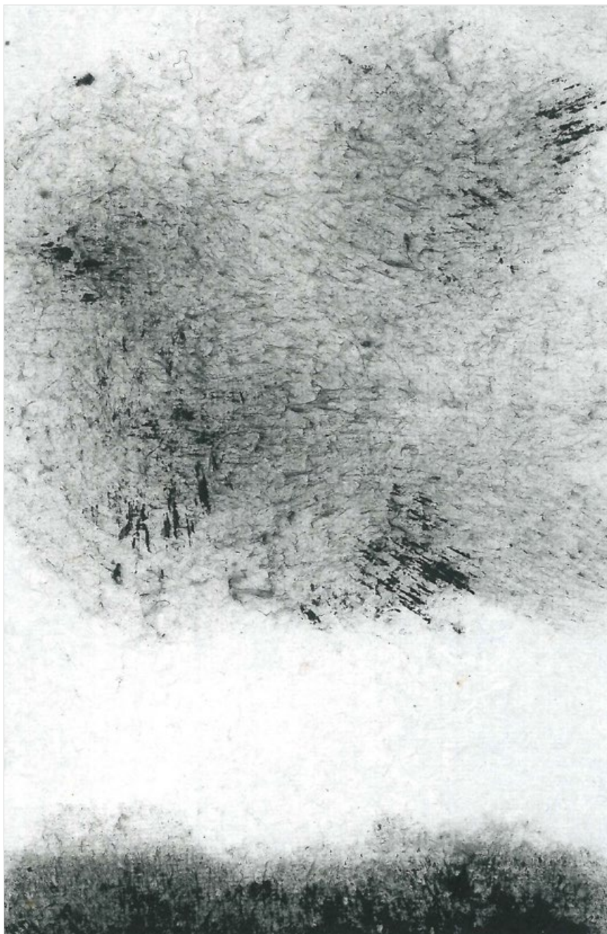
Před bouří, 2020, tuš, ruční papír, 12,5 x 8 cm