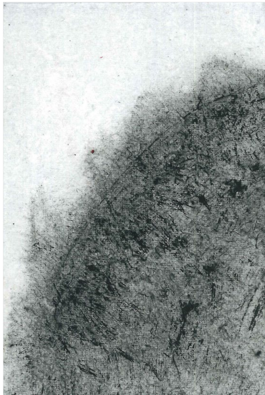
Kopec II, 2020, tuš, ruční papír, 12,5 x 8 cm