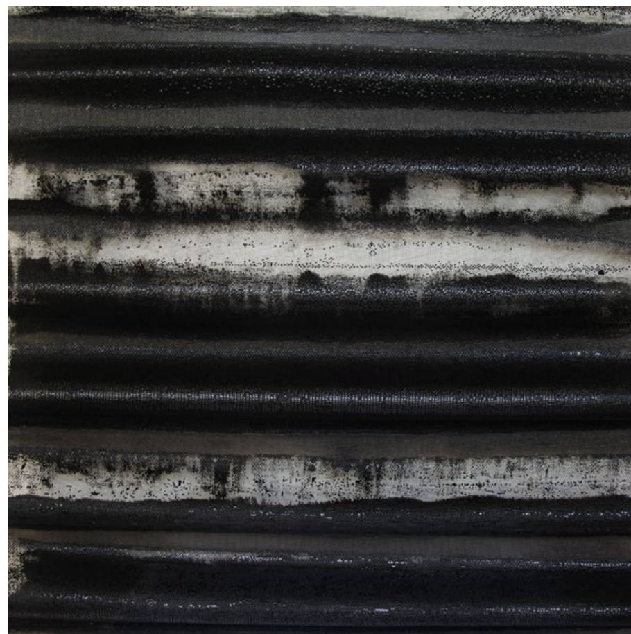
Šumění vody, 2020, syntetická barva na sklo, ohýbané sklovlákno, tabulové sklo, 70 x 70 cm