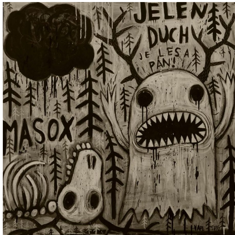
Jelen duch je lesa pán, akryl na plátně, 100 x 100 cm, 2016