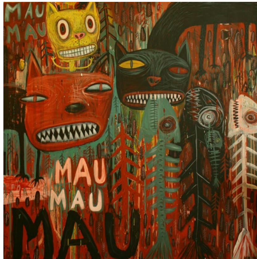
Mau mau, akryl na plátně, 100 x 100 cm, 2016