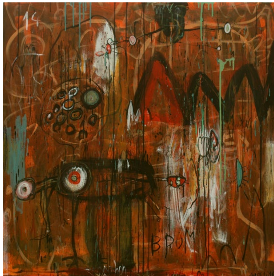
Komár na horách, akryl na plátně, 100 x 100 cm, 2016