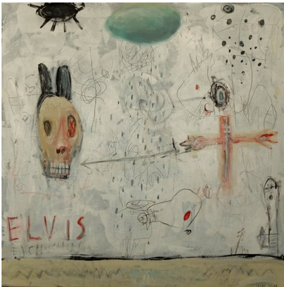
Elvis, akryl na plátně, 70 x 70 cm, 2017