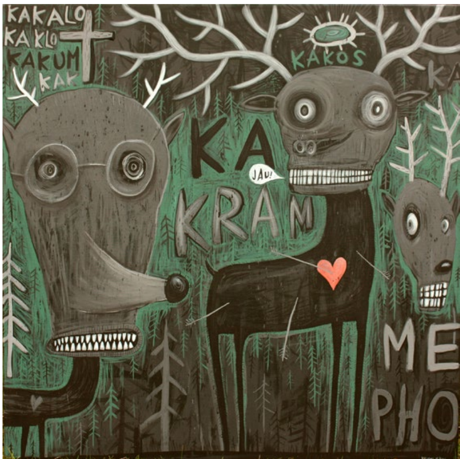
Kakalo kaklo, akryl na plátně, 100 x 100 cm, 2016