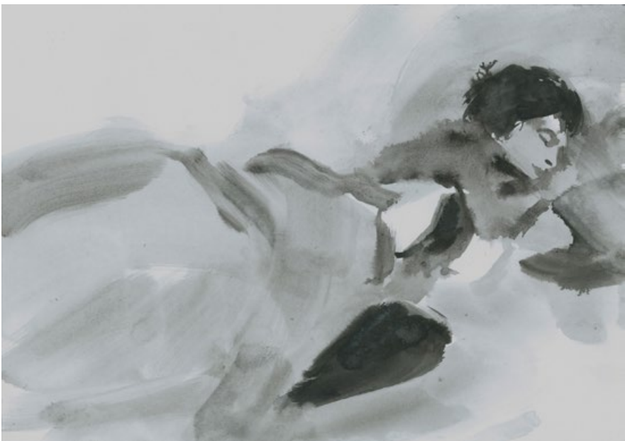
Zimní spánek REM, 2017, aquarell, tuš, papír, 297 × 420 mm