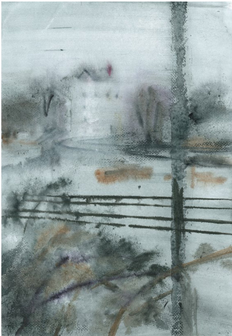
Smíchov III, 2017, aquarell, tuš, papír, 420 × 297 mm