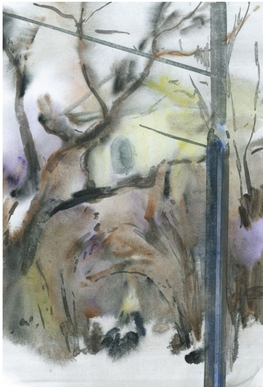
Ignác, 2017, aquarell, tuš, papír, 420 × 297 mm