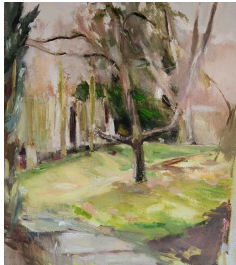
Miska, 2017, olej na plátně, 100 x 90 cm