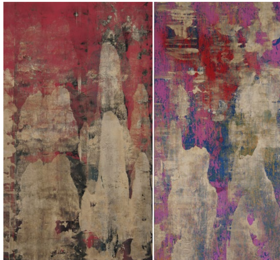
Rudé hory a Čínské hory, 2013, akryl, olej, plátno, 120 x 70 cm a 145 x 70 cm

www.patrikhabl.com / www.galerie-sumperk.cz