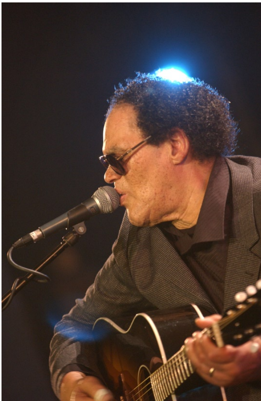
Louisiana Red