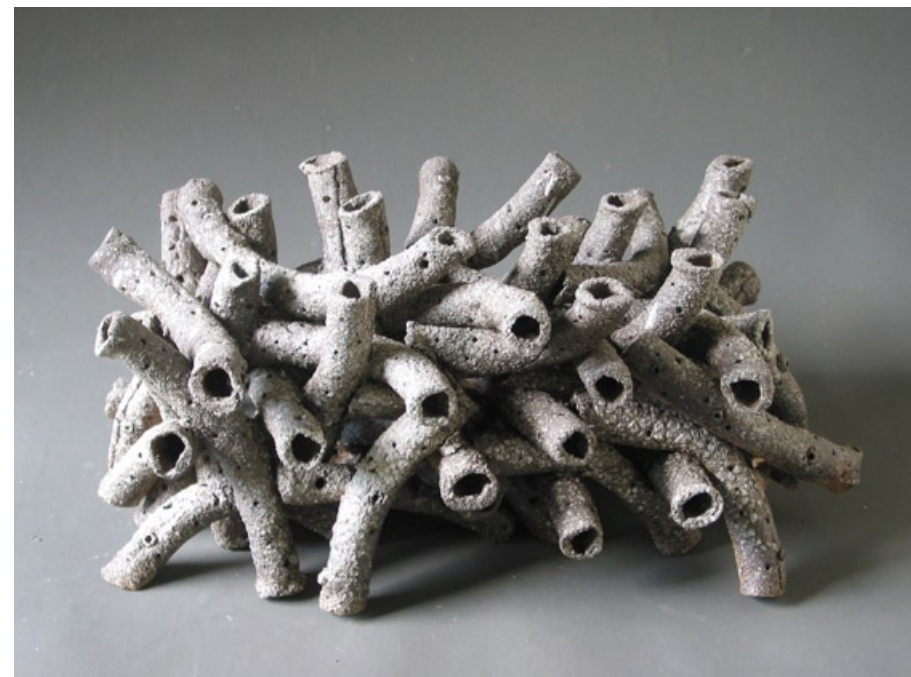
Objekt, 2004, keramika, 50 x 25 x 20 cm

adresa: ulice Míru 20, Horka nad Moravou, 738 35 telefon: 608 279 595 e-mail: bebarovi@gmail.com