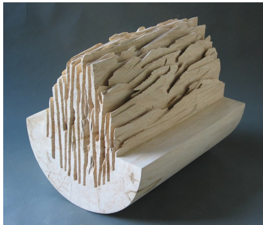
Údolí snů, 2007, javor, 52 x 43 x 38 cm

Oba překlady básní: Otto František Babler (1901 – 1984)