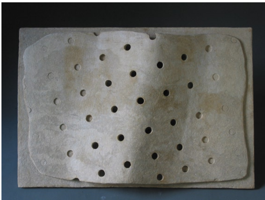
Relief, 2003, keramika, 50 x 32 cm

Zdánlivý paradox názvu mé výstavy možná ozřejmí můj postoj k výtvarnému umění jako k nezastupitelnému fenoménu, obohacujícímu náš život o silné emoce z vnímání barev, tvarů, prostoru... atd. Výtvarná činnost v mém pojetí je poněkud nesystematickou, avšak o to zajímavější cestou, při níž v reakci na vizuální inspirace svobodně pracuji chvíli jako kreslíř a potom jako sochař, tvůrce drobných instalací nebo keramiky, či jindy jako malíř.