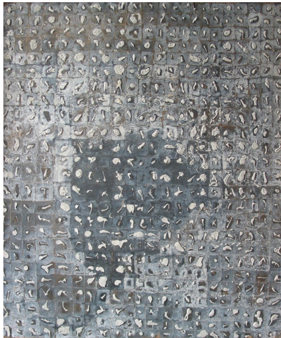
Dobry den, 1999, tempera, beton, 70 x 60 cm