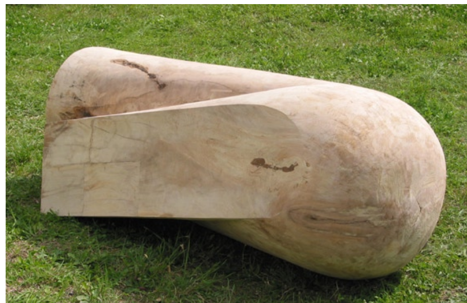
Socha, 2007, javor, 200 x 80 cm