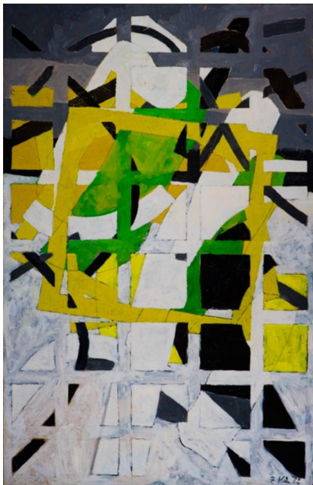
Zdeněk Hůla, Černožlutý prostor, 1982, olej, plátno, 140 x 89 cm

To sama příroda nám „sklonila hlavu“ těsněji k sobě. Je naším protějškem, náručí a zrcadlem, ve kterém se uhranutě poznáváme. Vtahuje nás zpátky domů do nitra nahé hmoty svého bytostného těla a odhaluje se nám ve svých proměnách. Co zdálo se únikem ze skutečnosti, je náhle a naopak věčně novým pokusem o plnější návrat k ní a skrze ni i k sobě. Pokusem o prohloubení vzájemné blízkosti, až po zapomenutí se malbou v ní.