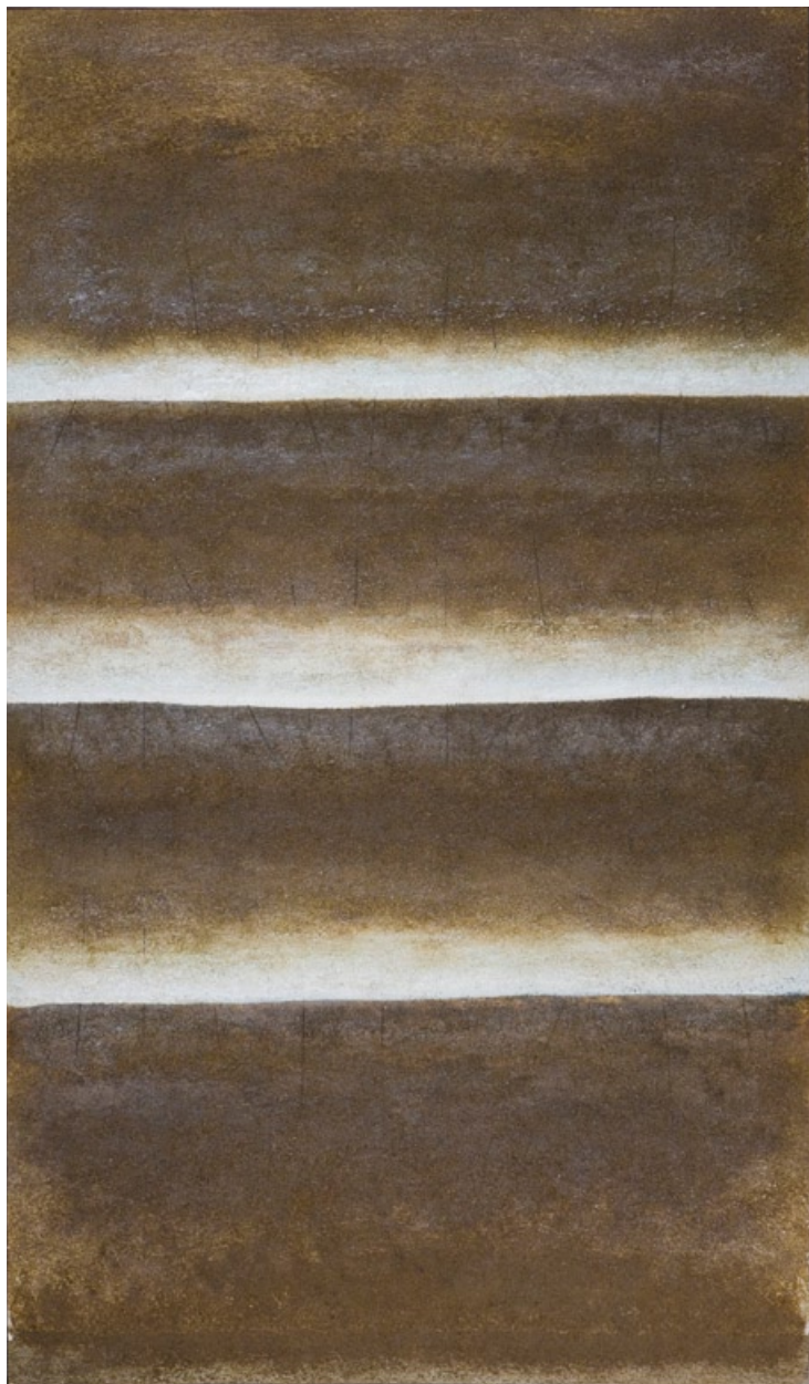
Miroslav Koval, Moře II., 1986, kaseinová tempera, překližka, 122 x 70 cm

„Hledám zemi ve stavu nevinnosti“ / Giuseppe Ungaretti ( 1888-1970)