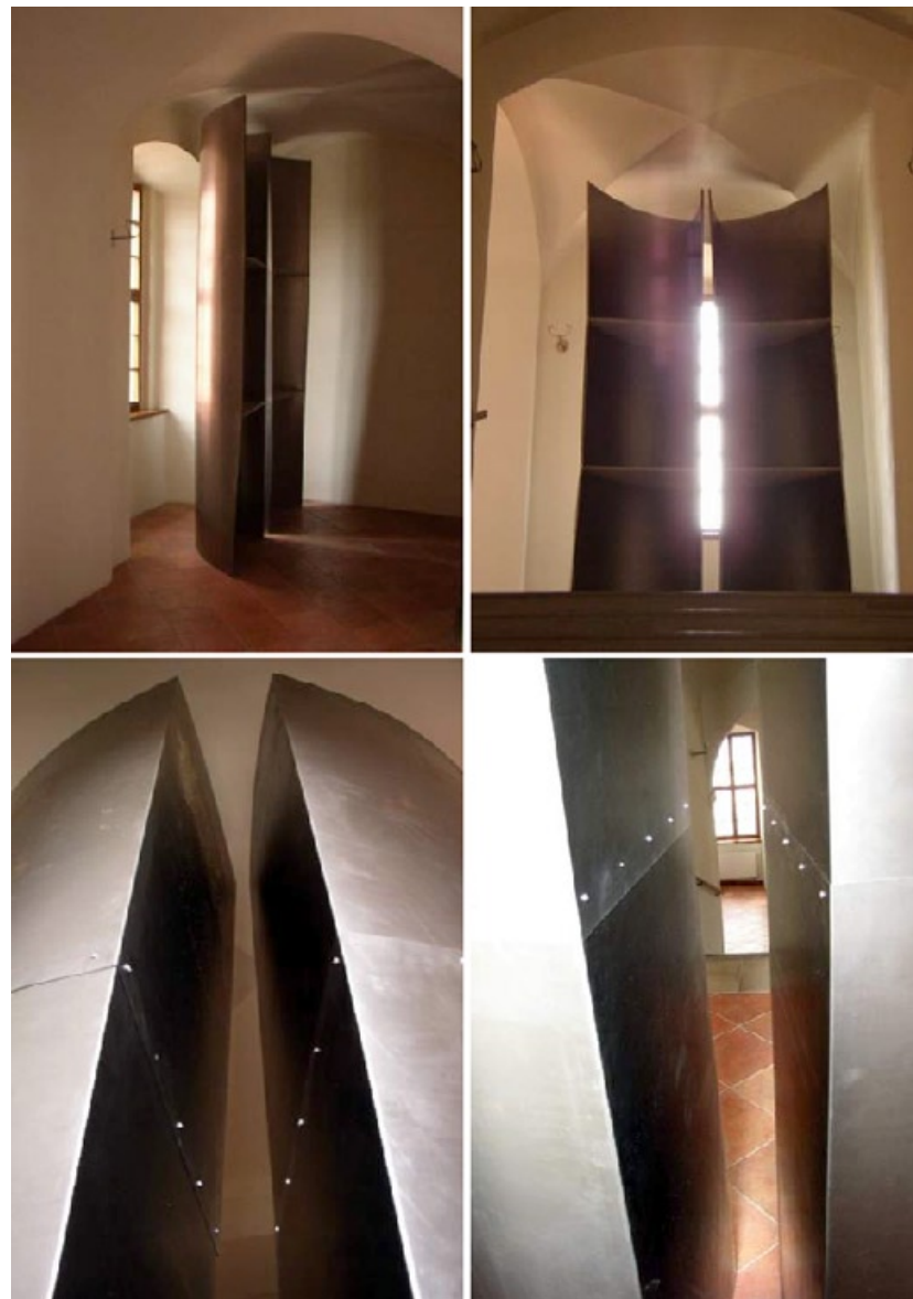
Enter (Vstup), 2005, Jezuitský konvikt UP Olomouc, plechové půlválce, 360 x 160cm (s arch. Tomášem Rýdlem)