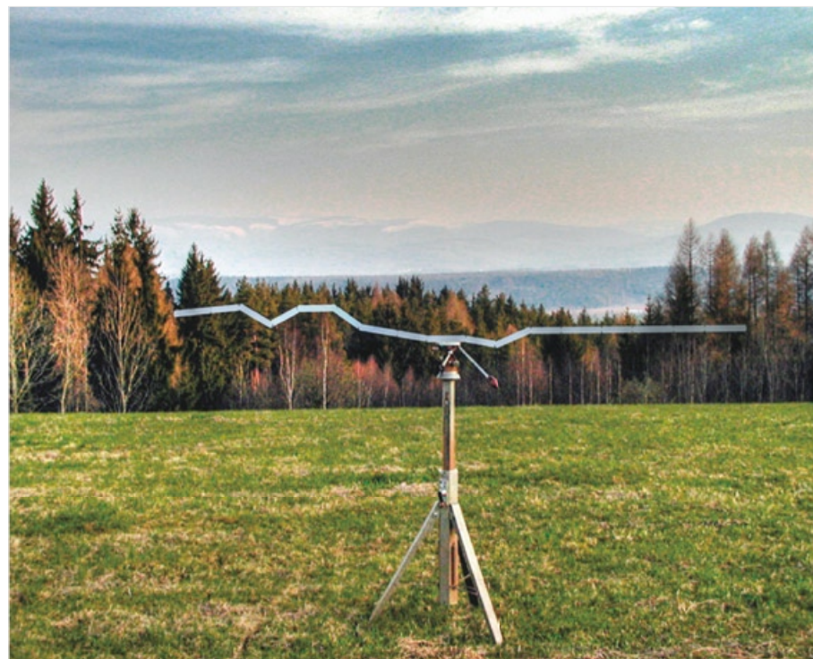
Variabilní horizont, 2008, leštěný hliník, 350 x 120cm