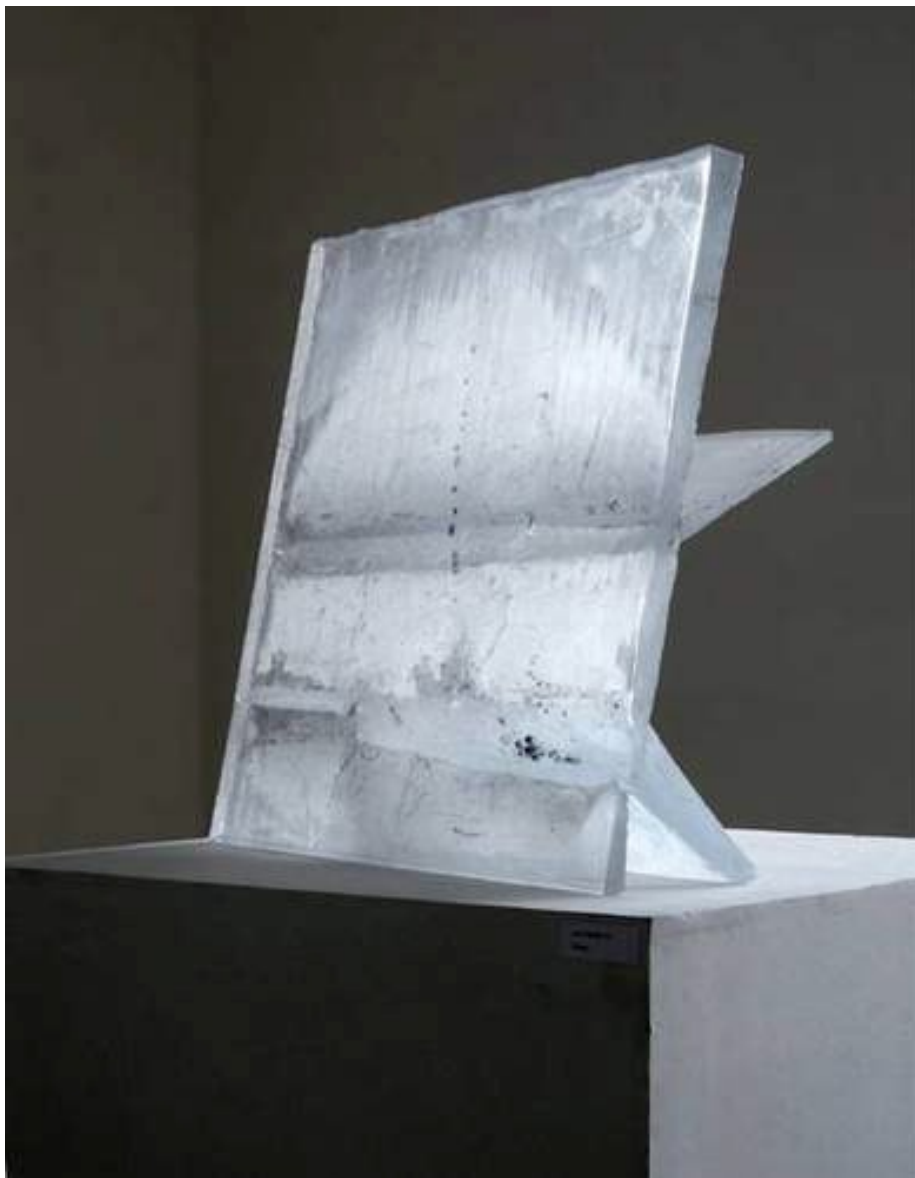
Horizont, 2004, tavené sklo, 100 x 100 x 40cm