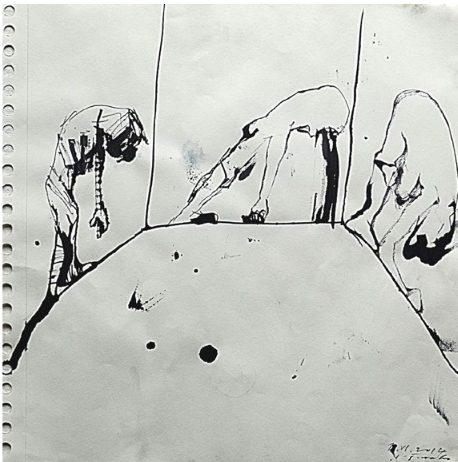
Nedořečenosti č.82, 18. 6. 2014, tuš, papír 30 x 30 cm