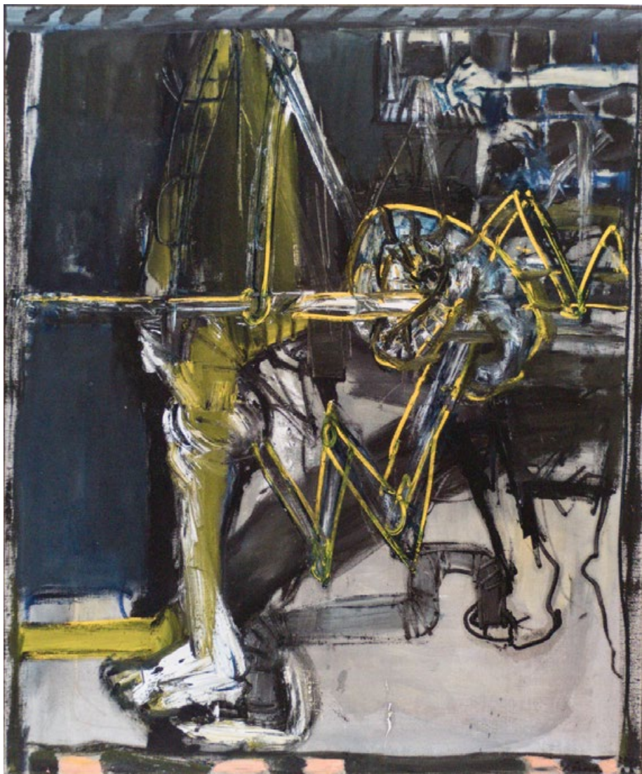
Záda – uzel, 2012, olej, plátno, 145 x 120 cm