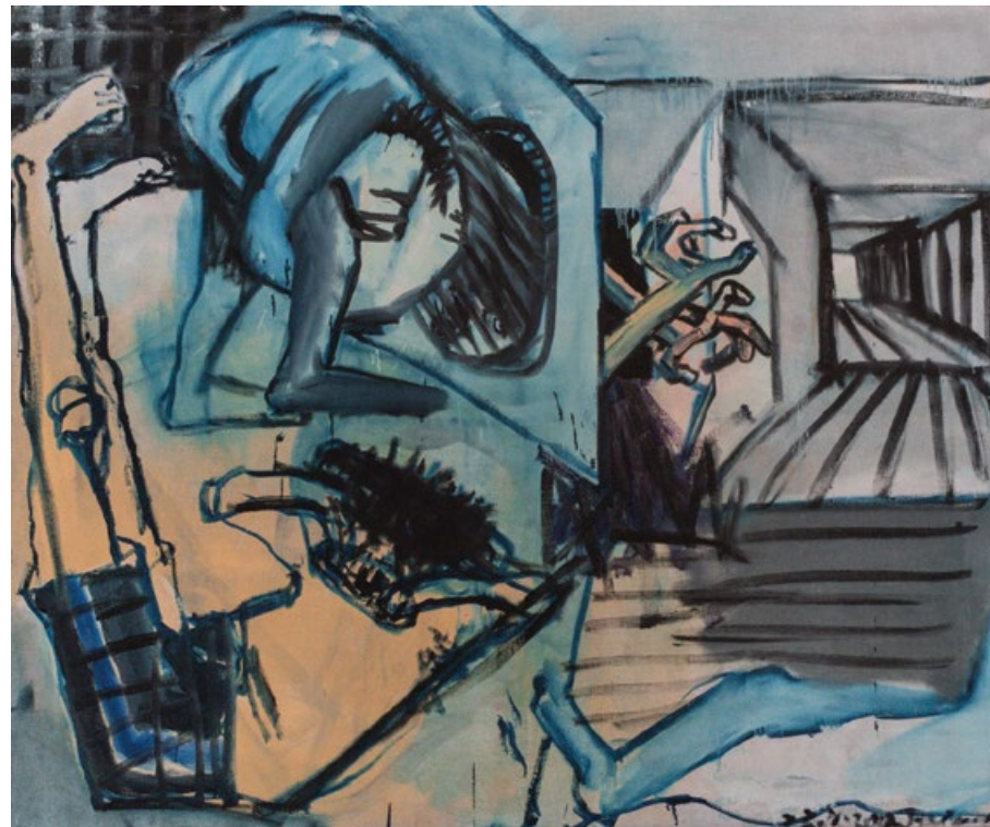
Výklenky, 2012, olej, plátno, 120 x 145 cm