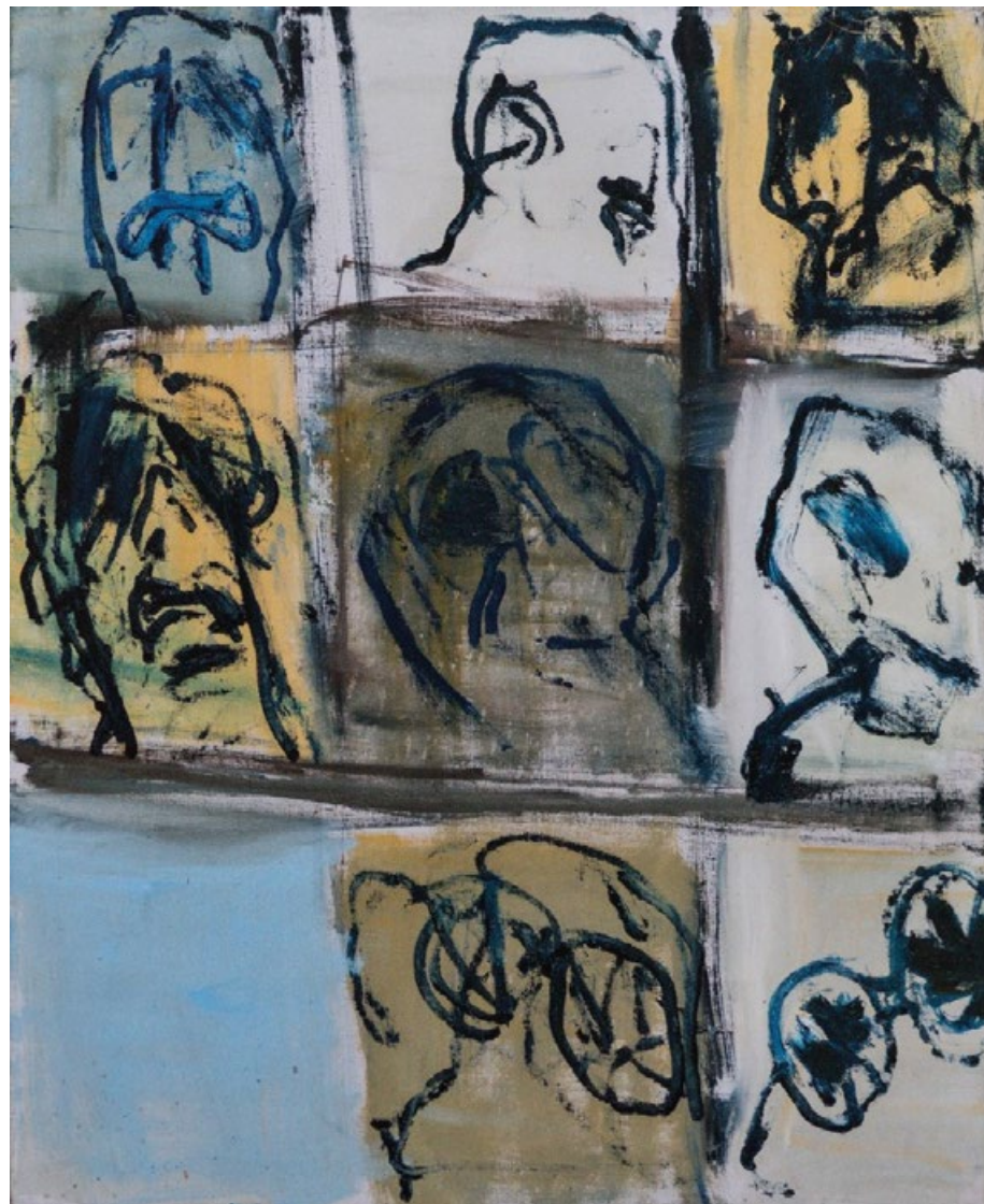
Dveře, 2017, olej, plátno, 100 x 81 cm