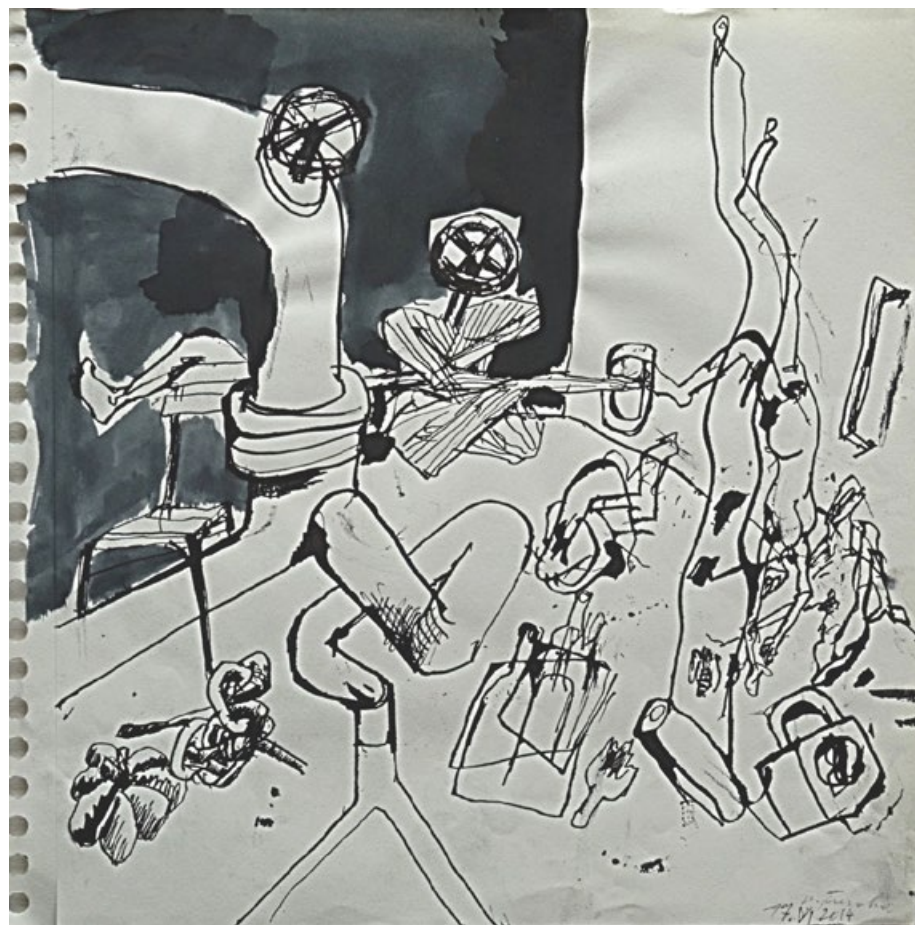
Nedořečenosti č.80, 17. 6. 2014, tuš, papír 30 x 30 cm