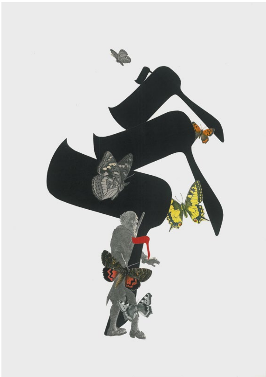
Dalet, Cestou motýlů, koláž na papíře, 42 x 29,7 cm, 2002 (z cyklu Hebrejská abeceda)