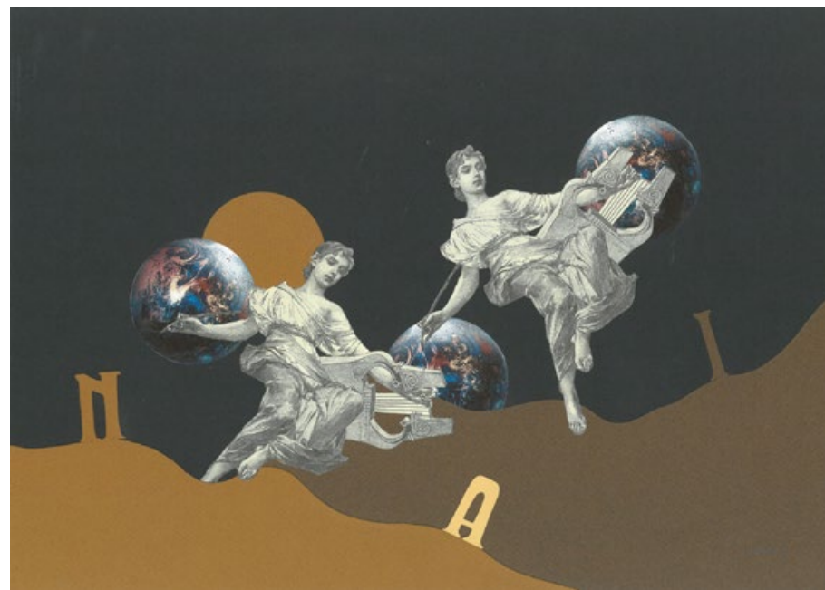
Báseň psaná o zemi, koláž na papíře, 29,7 x 42 cm, 2017