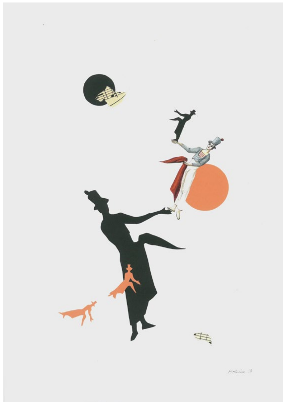
Bip zrozený ze tmy, koláž na papíře, 29,5 x 21 cm, 2018 (z cyklu Pocta Marcelu Marceauovi)