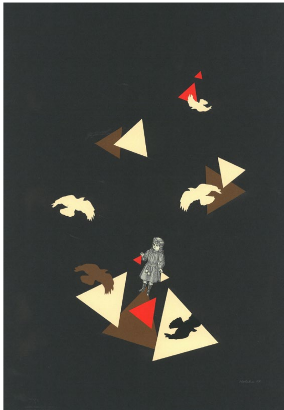
Hra v ptáčím světě, koláž na papíře, 60 x 42 cm, 2018 (z cyklu Dětské hry)

(Pavel Holeka, z připravované sbírky básní)