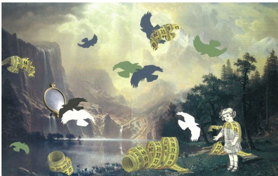
Sto dnů v zemi za zrcadlem, koláž na papíře, 23 x 38,5 cm, 2017