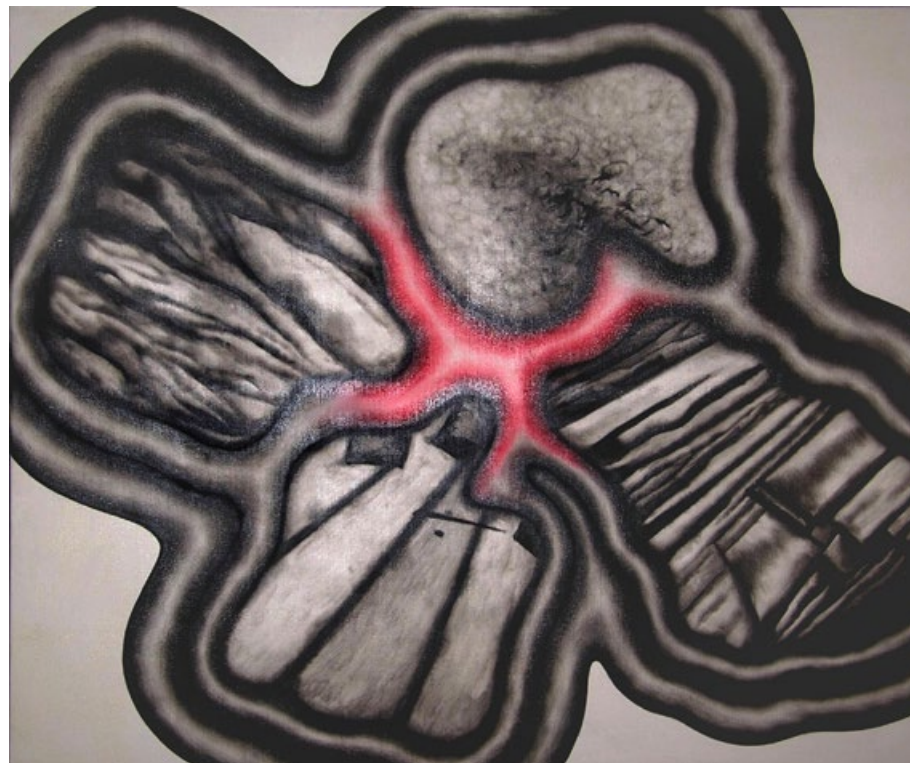
Exaltovaný anděl (výřez obrazu), 2005, olej na plátně, 130x160 cm