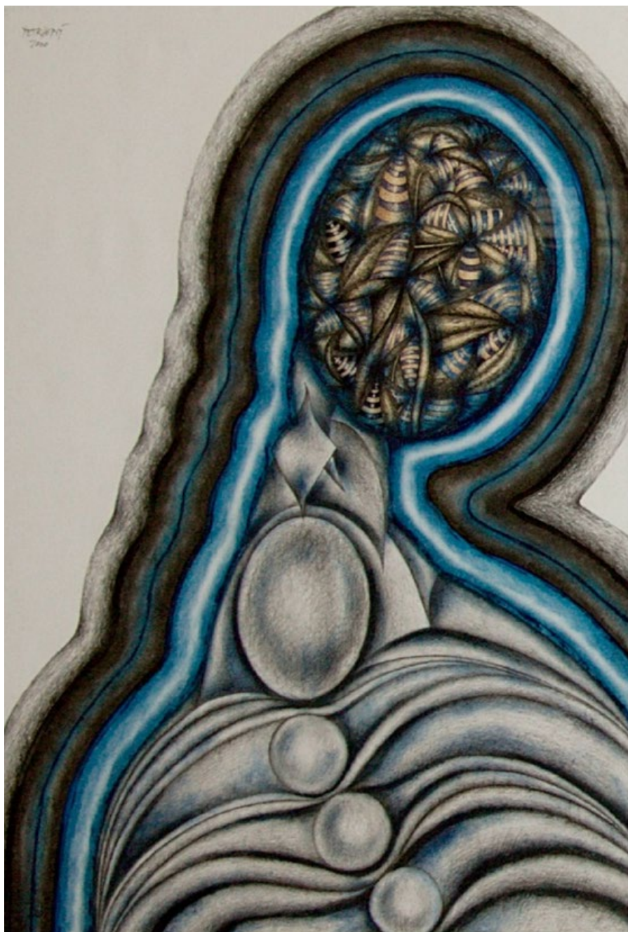
Vnitřní harmonie, 2000, tužka, pastel, tuš, papír, 90x60 cm