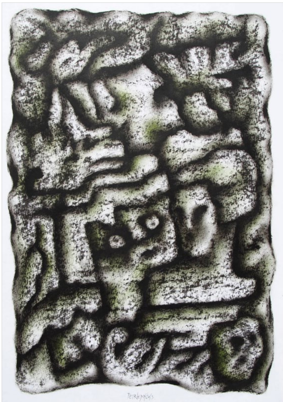
Zkamenělý sen, 2013, uhl, pastel, papír, 85x60 cm