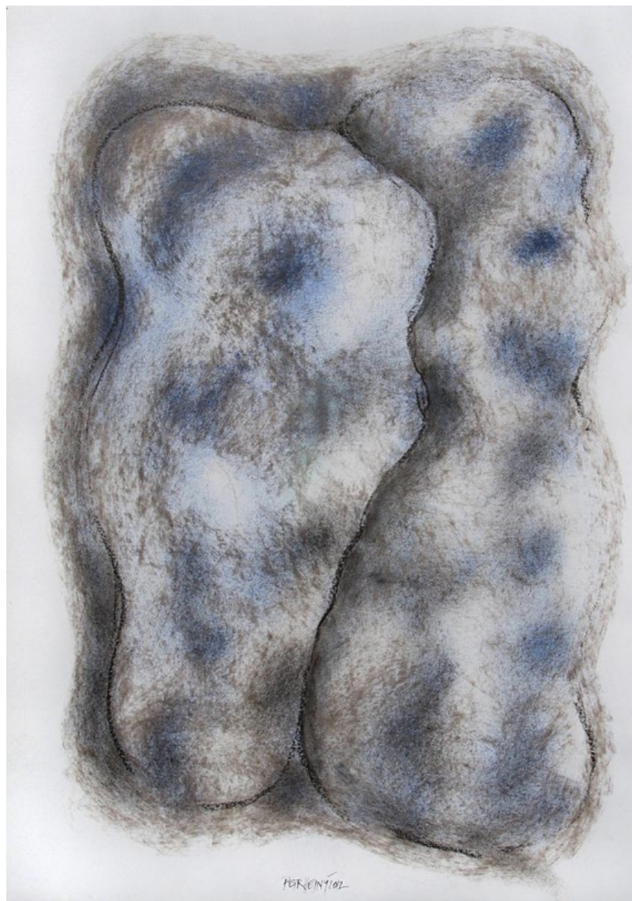
Blížkost - Dušičky, 2012, uhl a pigment na papíře, 60x40 cm