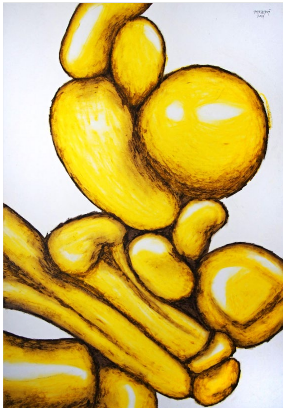
Detail kudlanky, 2017, pastel, papír, 100x70 cm