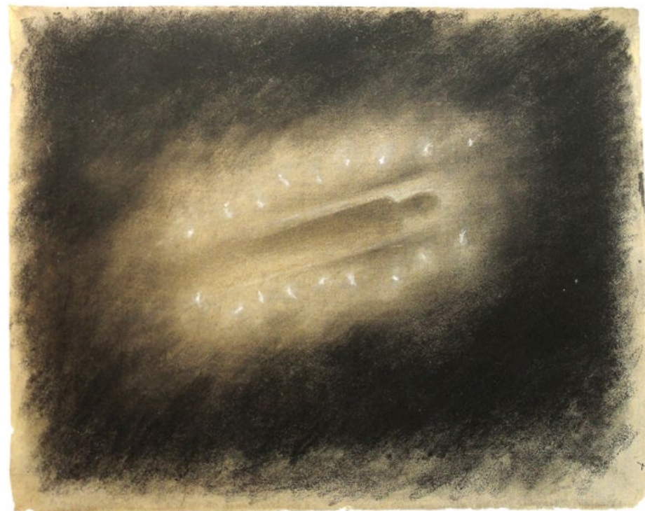
A po bažině, po sluji modrá světélka laškují, 50. léta, uhel, pastel, papír 45 x 57,5 cm