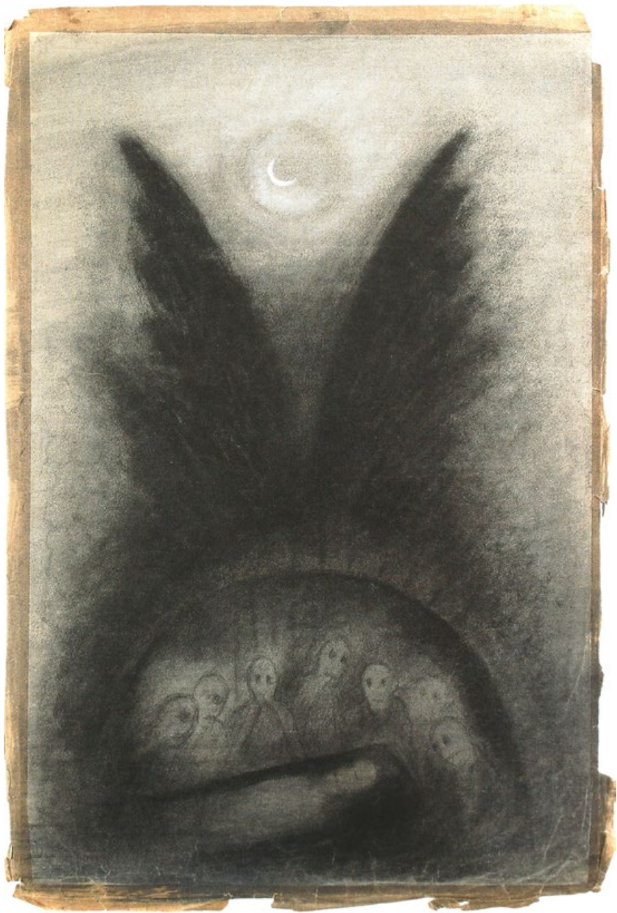
Stráž nad mrtvým, 50. léta, uhel, bílý pastel, papír, 75 x 50 cm