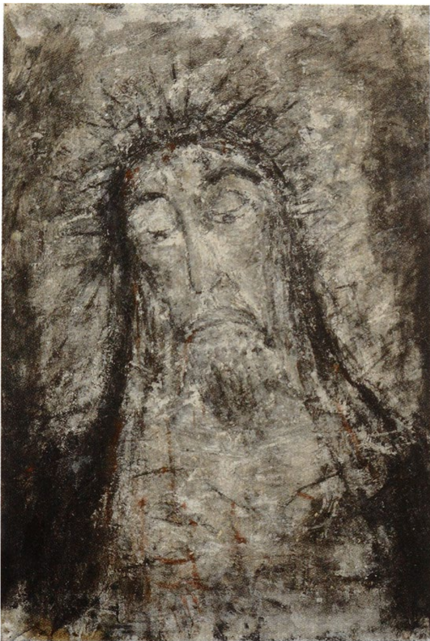
Bolestný Kristus, 1951, kvaš, lepenka, 60 x 40 cm