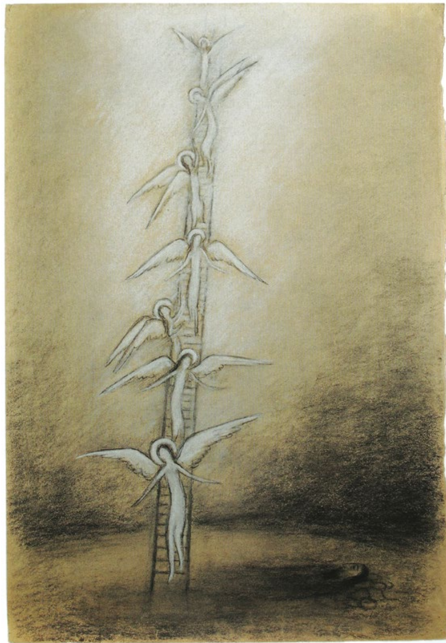
První kniha Mojžišova, Jákobův žebřík, 50. léta, uhel, bílý pastel, papír, 74 x 50 cm