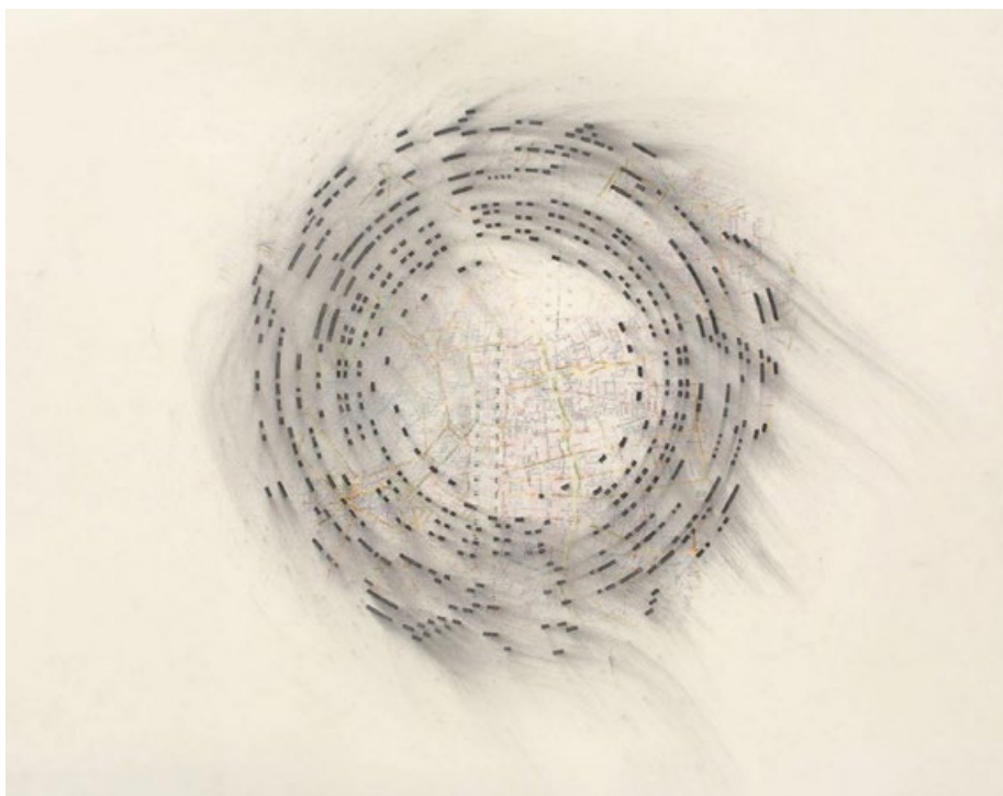
V katalogu jsou použity reprodukce kreseb z let 2015 až 2017. Na straně tři je výřez z plátna Káhira 2015.