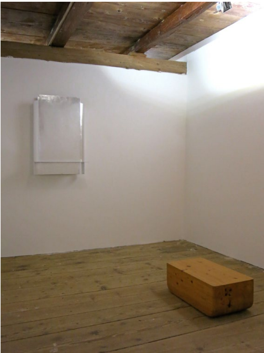
Bez názvu, 2016, 85x60x14 cm, plech, plátkový hliník Bez názvu, 2004, 80x45x22 cm, dřevo, lak