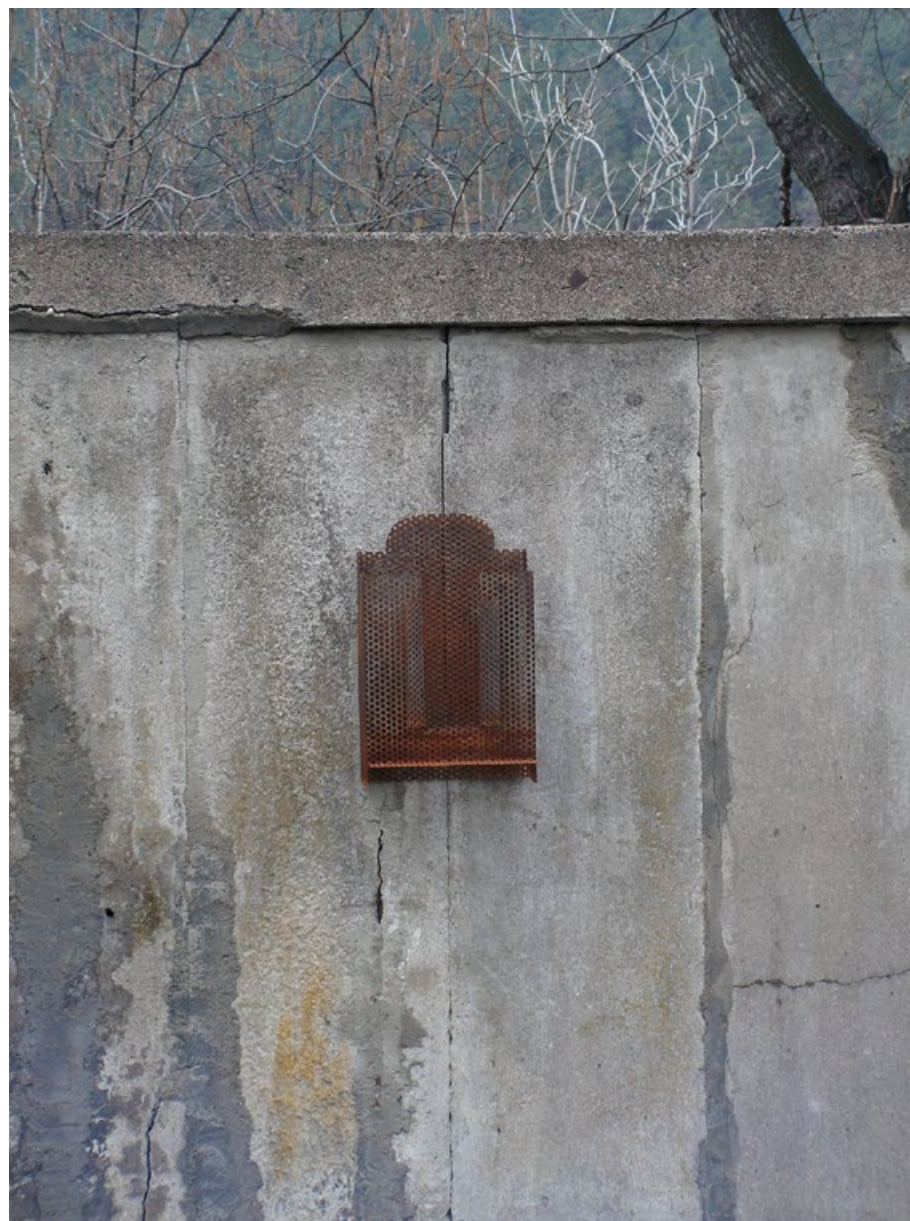
Bez názvu, Svojšice 2006, 22x38x15 cm, plech