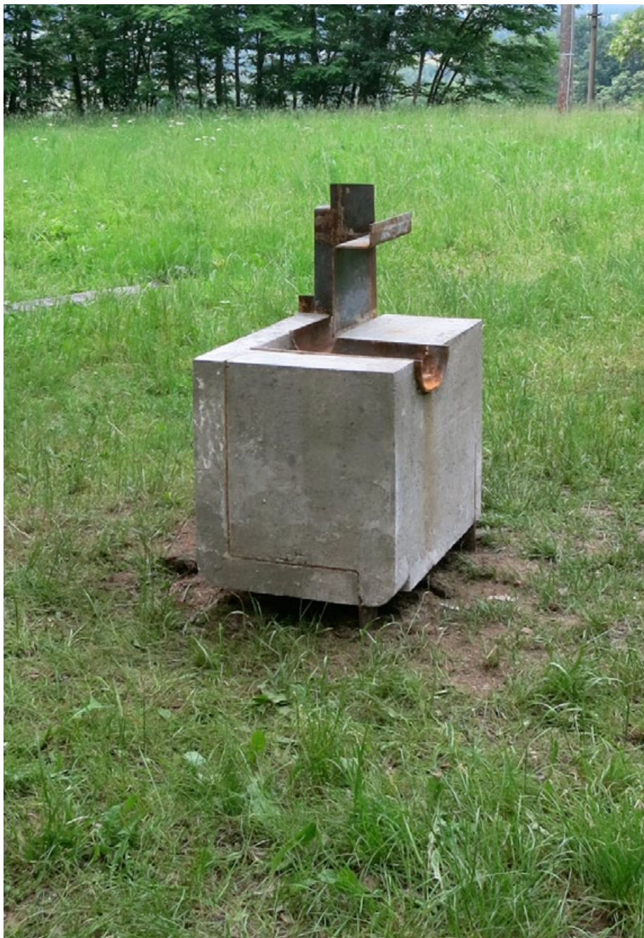
Bez názvu, 2016, 70x55x90 cm, beton, železo