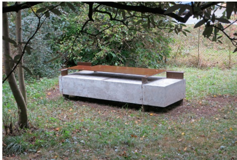
Bez názvu, 2016, 220x79x65 cm, beton, železo