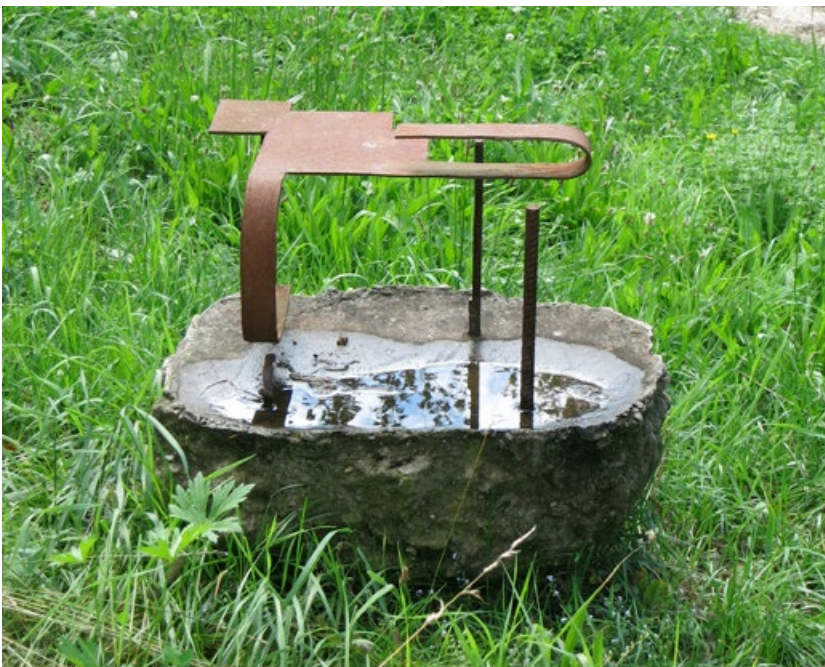
Bez názvu, 2006, 50x40x70 cm, beton, železo