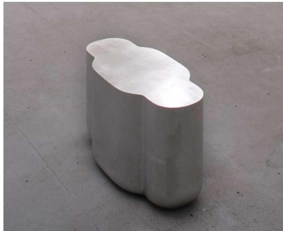
Bez názvu, 2008, 70x36x40 cm, dřevo, plátkový hliník