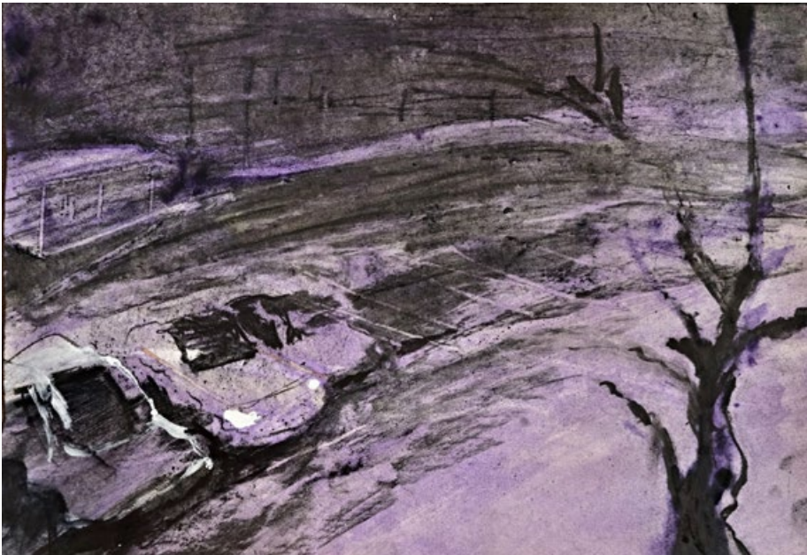
Ve tři ráno, 2015, kombinovaná technika na papíře 30 x 50 cm