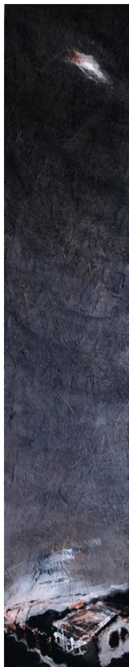
Ve tři ráno, 2015, dřevo 70 x 30 cm / Na chatě, 2015, dřevo 130 x 30 cm