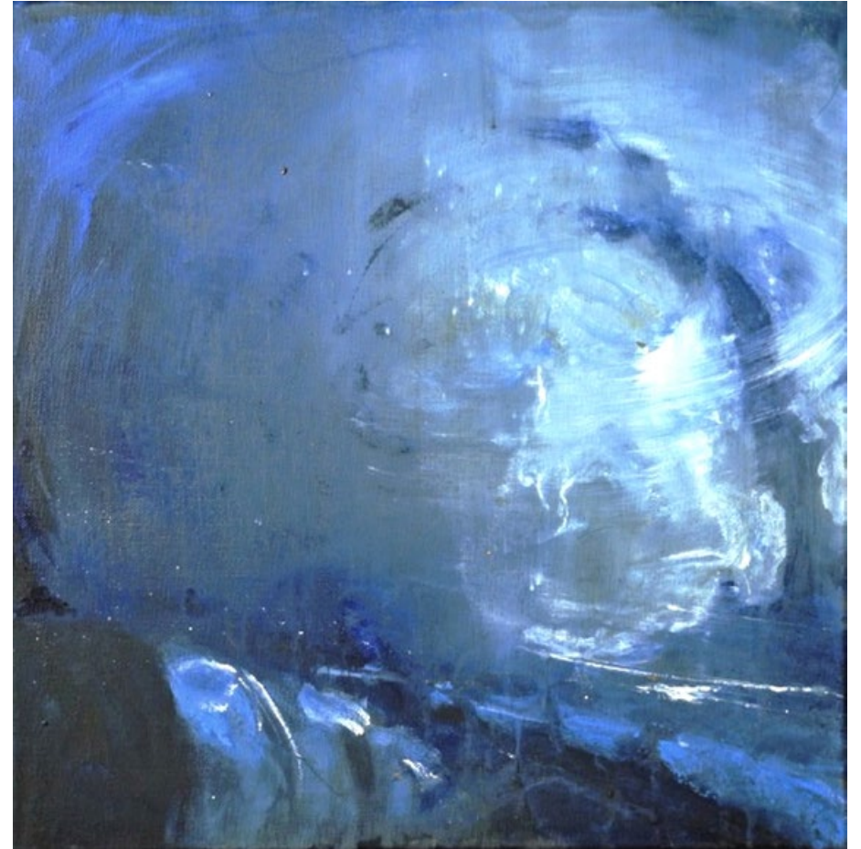
Kolona, 2014, kombinovaná technika na dřevě, 50 x 50 cm