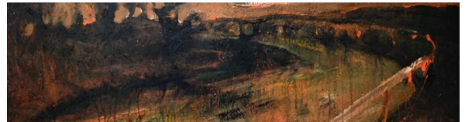
Ve tři ráno, 2016, kombinovaná technika na dřevě, 50 x 120 cm