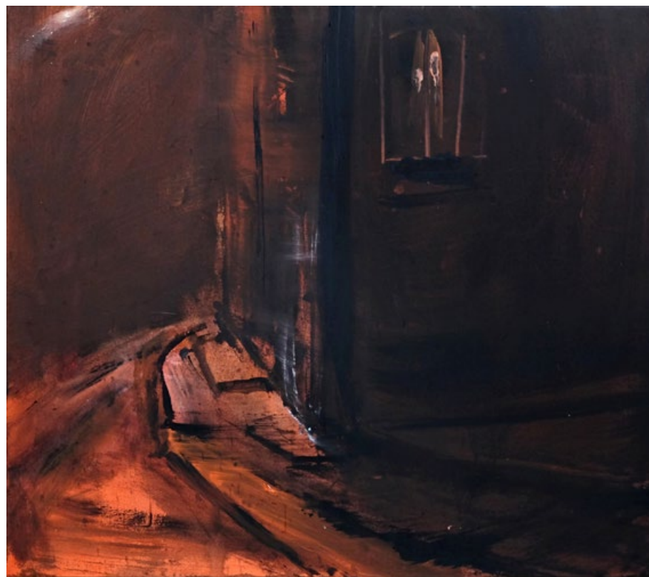
Za rohem, 2015, kombinovaná technika na plátně, 60 x 70 cm