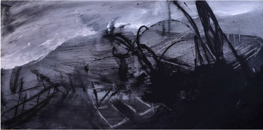
Na chatě, 2015, kombinovaná technika na dřevě 40 x 70 cm