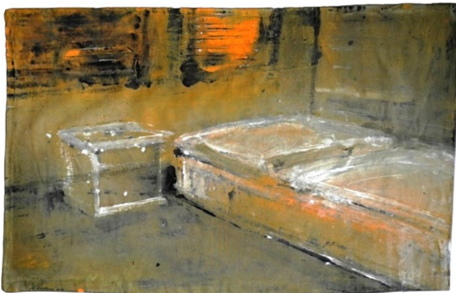
Špitál, 2014, kombinovaná technika na plátně, 40 x 60 cm