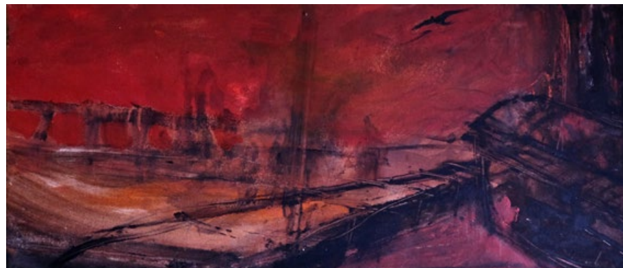
Ve tři ráno, 2015, kombinovaná technika na dřevě 40 x 100 cm

Samota, jako deště k ránu, navečer stoupá z vod oceánu, z dalekých plání, lesů, luk a lánů do nebe, jež ji od věčnosti má. Teprve pak ji město přijímá.