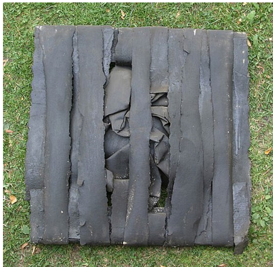
80 léta, dřevo, térový papír

„... Chodit po světě, okounět, žvejkat vzdoušek horký i zvlhlý, plískanice, mít nos zmrzlý a nebejt moc ohleduplný k sobě; co by to bylo za tvora, když – vráska mu na čele vyskočí pro nic za nic...“