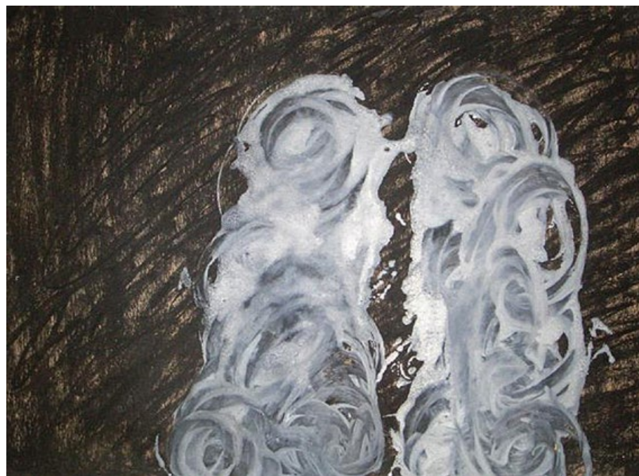
Dva, 80. léta, uhel, tempera