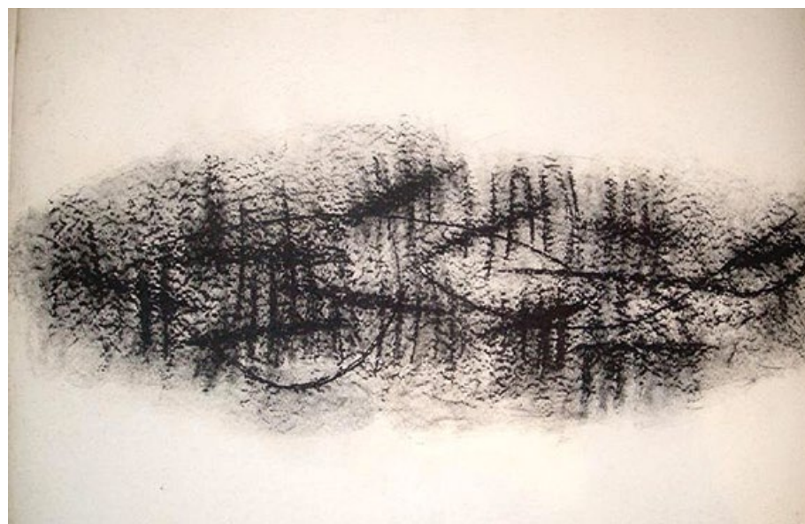
Panorama, 80. léta, kresba uhlem