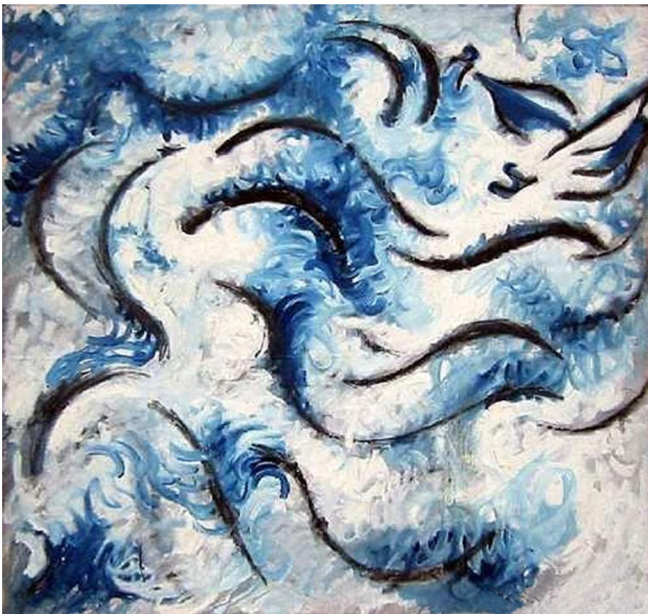
Olejomalba, 70. léta, 100 x 100 cm