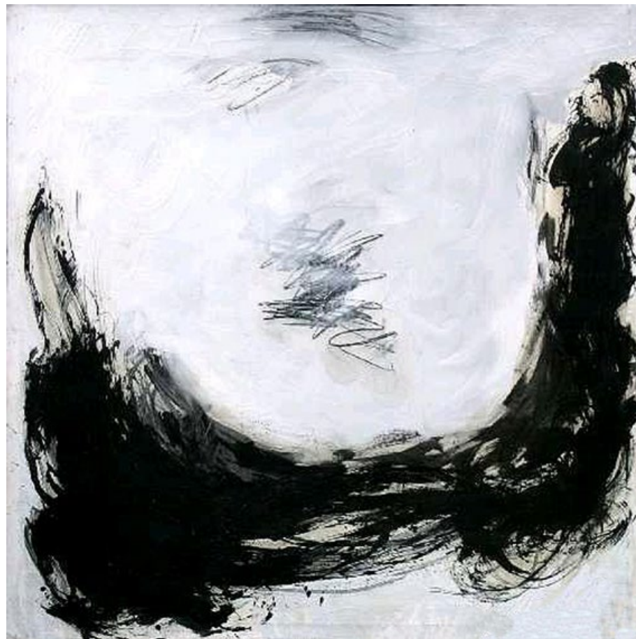
Olejomalba, 80. léta, 124 x 124 cm

Alvovo dílo dává otázku, jestli nestačí, když umění vypadá, jakoby vzniklo a vyrostlo samo z energie, kterou umělec po chvíli své existence zprostředkovává. Když jen materializuje, co je v zemi, v současnosti, v historii jistého místa.