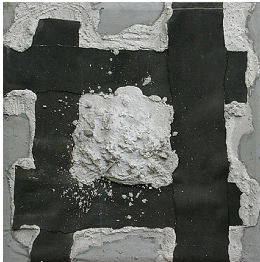
Reliéfní objekt, 80 léta, cement a térový papír