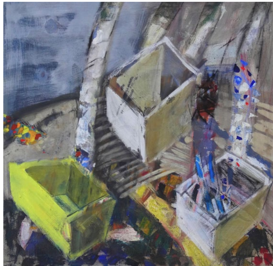
Houbaři, 2010, olej na plátně, 80 x 80 cm