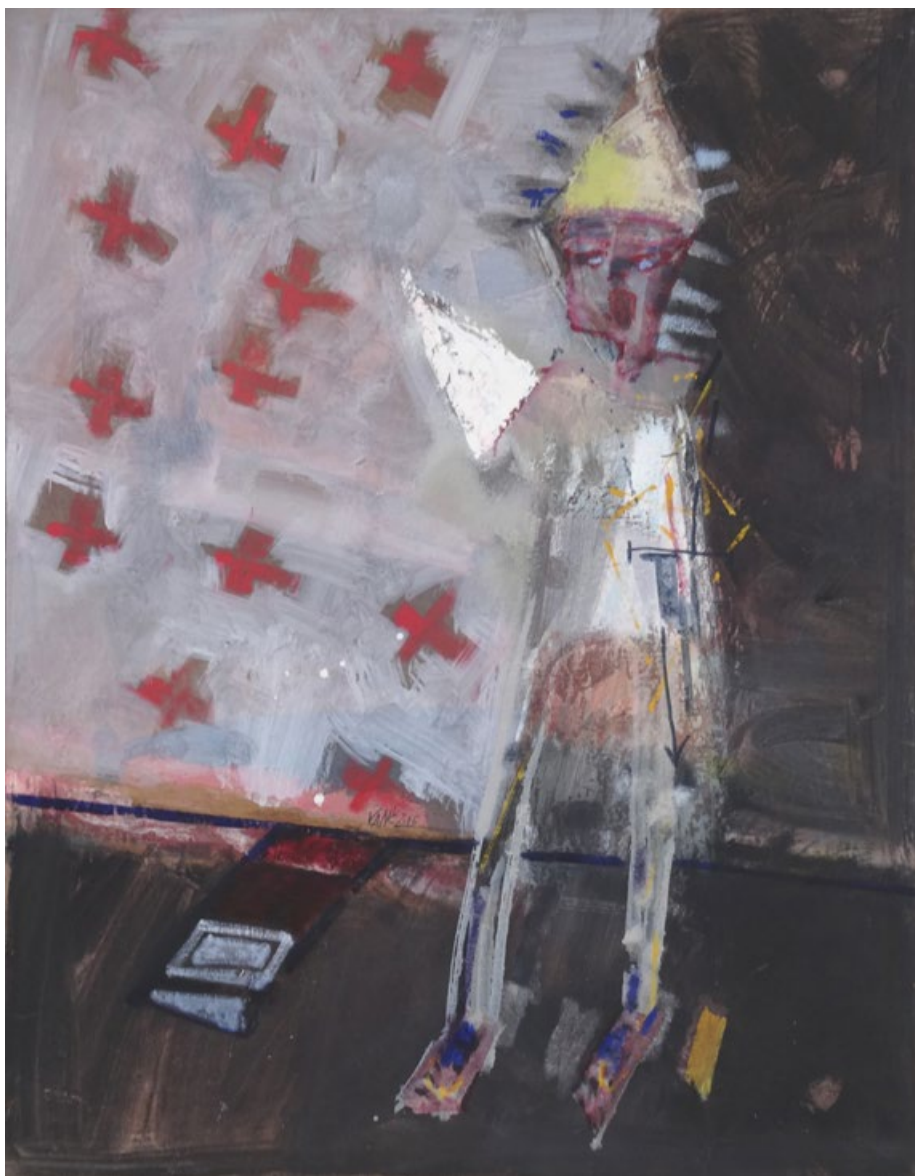
Pan Ještěrka, 2006, olej na plátně, 90 x 70 cm