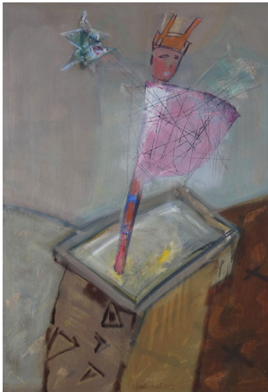
Křesadlo, 2012, olej na plátně, 100 x 80 cm