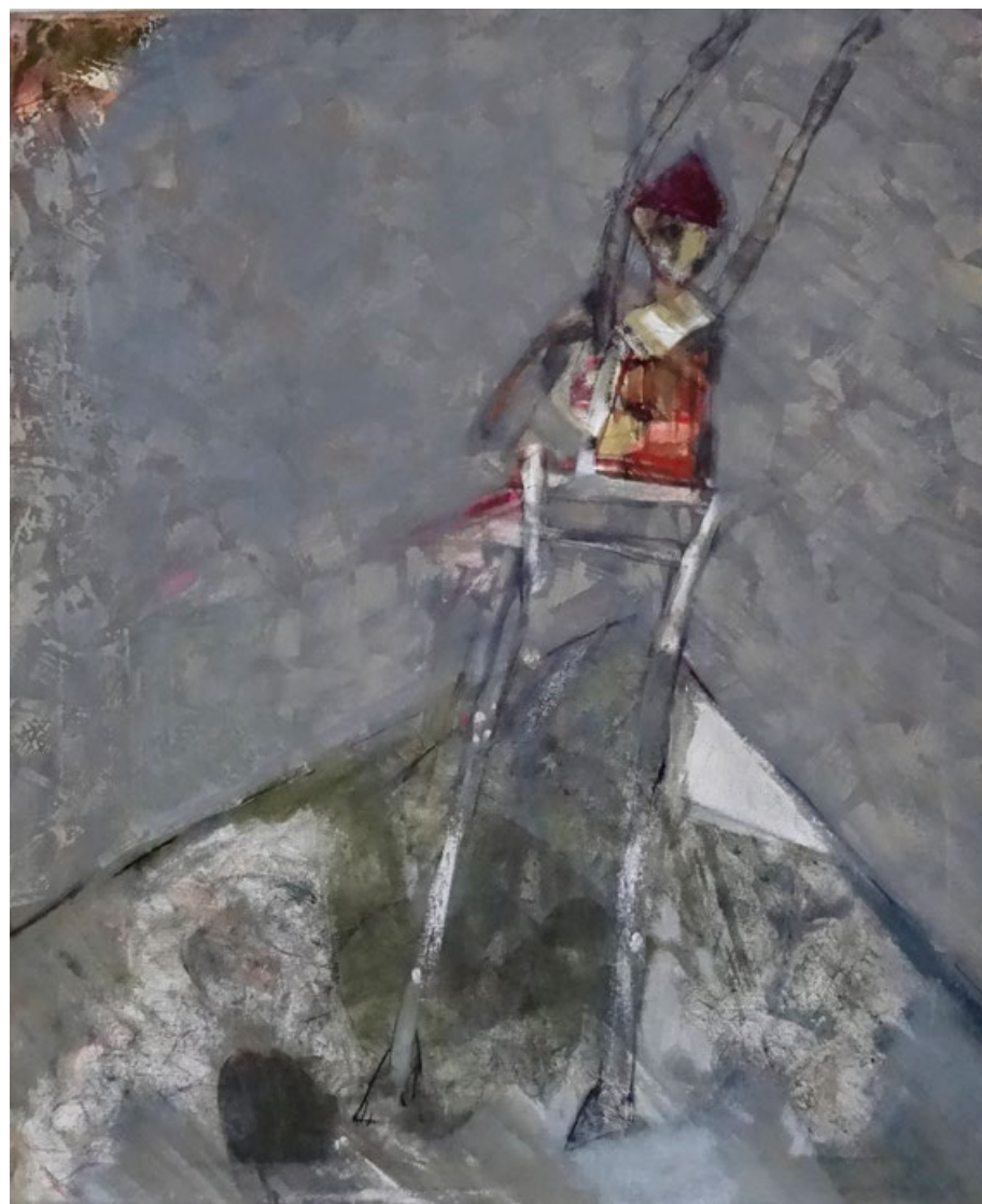
Židle, 2013, olej na plátně, 85 x 70 cm