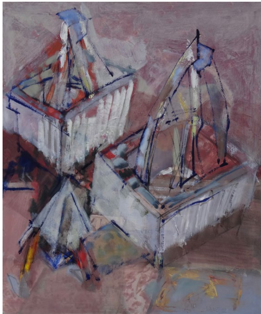
Krabíčky II, 2012, olej na plátně, 95 x 90 cm