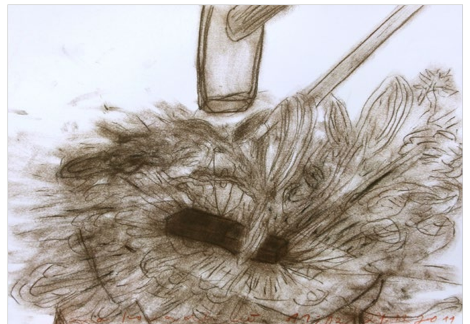
Na kovačine, rudka, 30 x 42 cm, 11:02 h, 27. 12. 2011