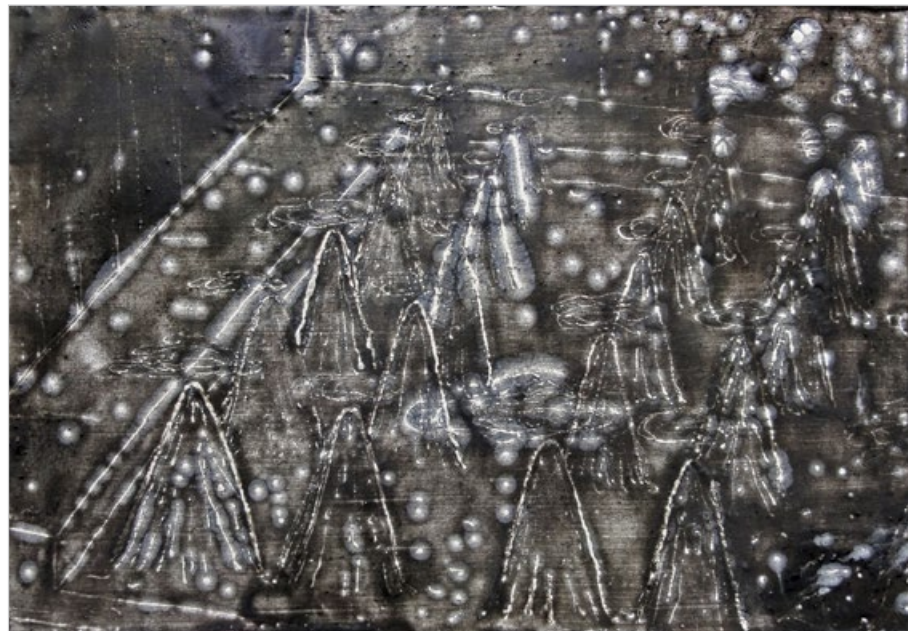
Popelová krajina 3, 2014, enkaustika na plátně, 35 x 50 cm