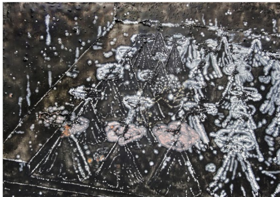
Popelová krajina 5, 2014, enkaustika na plátně, 70 x 100 cm