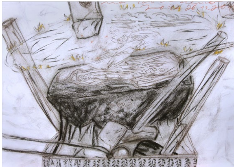
Na kovadlině, přírodní uhlí a pastel, 30 x 42 cm, 20:01 h, 26. 11. 2011