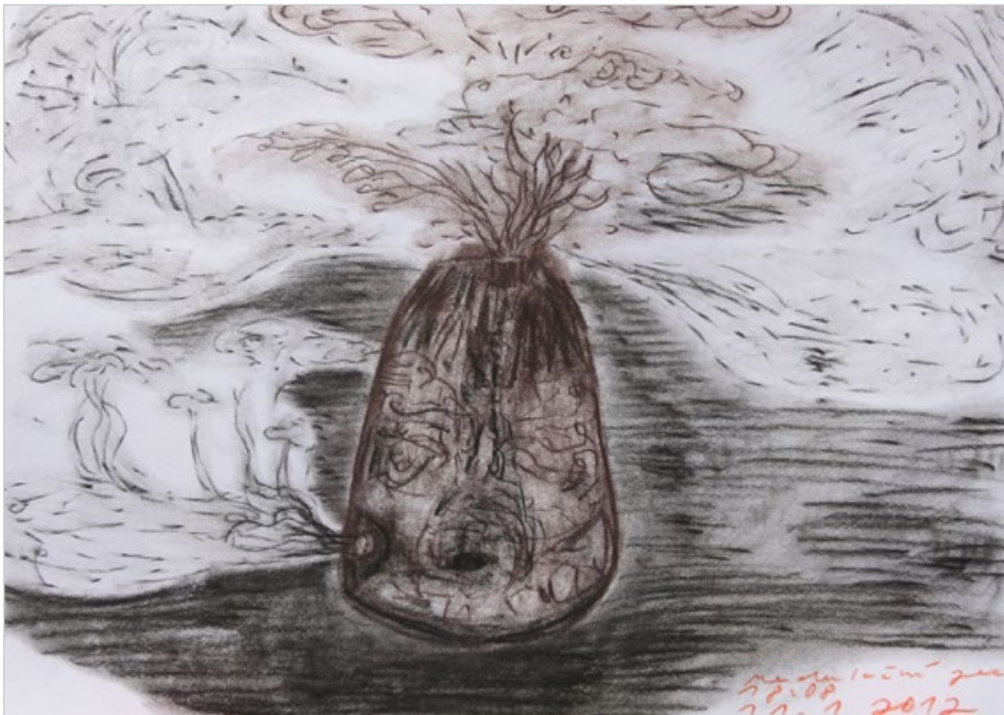
Redukční pec, rudka a prírodný uhl, 30 x 42 cm, 18:08 h, 11. 1. 2012