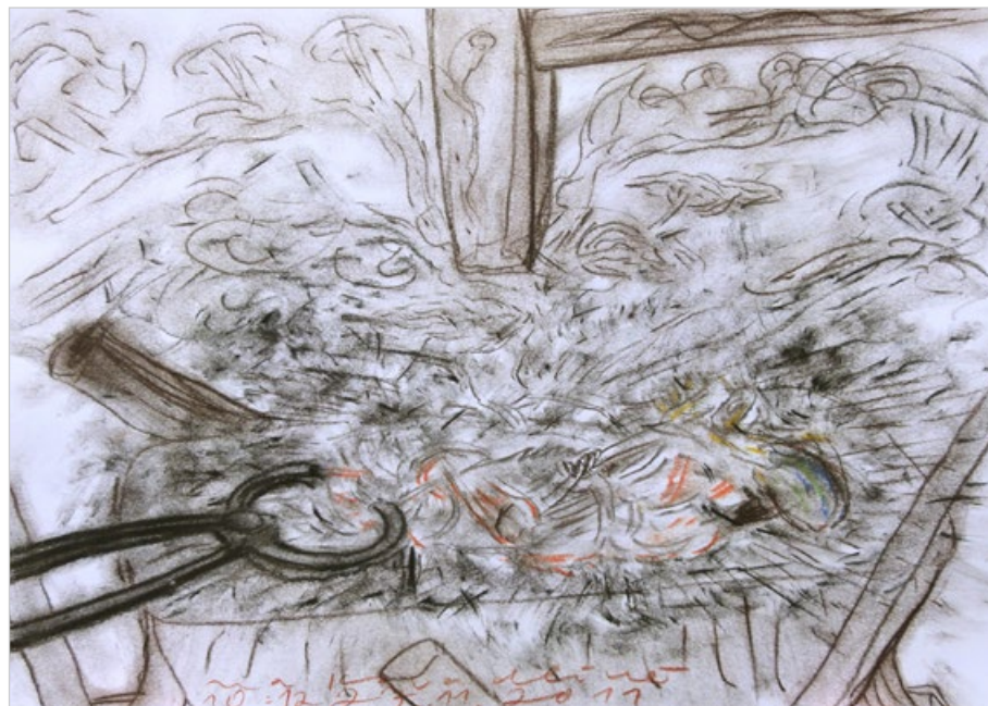
Na kovadlině, přírodní uhlí a pastel, 30 x 42 cm, 10:12 h, 27. 11. 2011