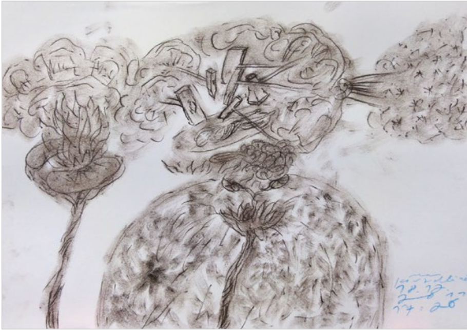
Nad kovačinou, prírodný uhl, 30 x 42 cm, 17:20 h, 18. 12. 2011