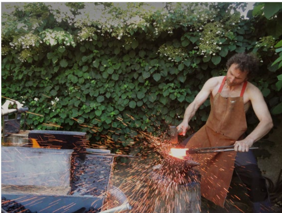
Zahradní kování, 2014