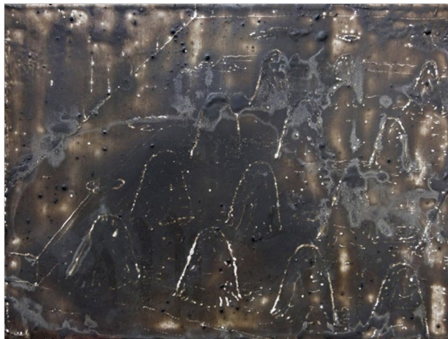
Popelová krajina 1, 2014, enkaustika na plátně, 30 x 40 cm