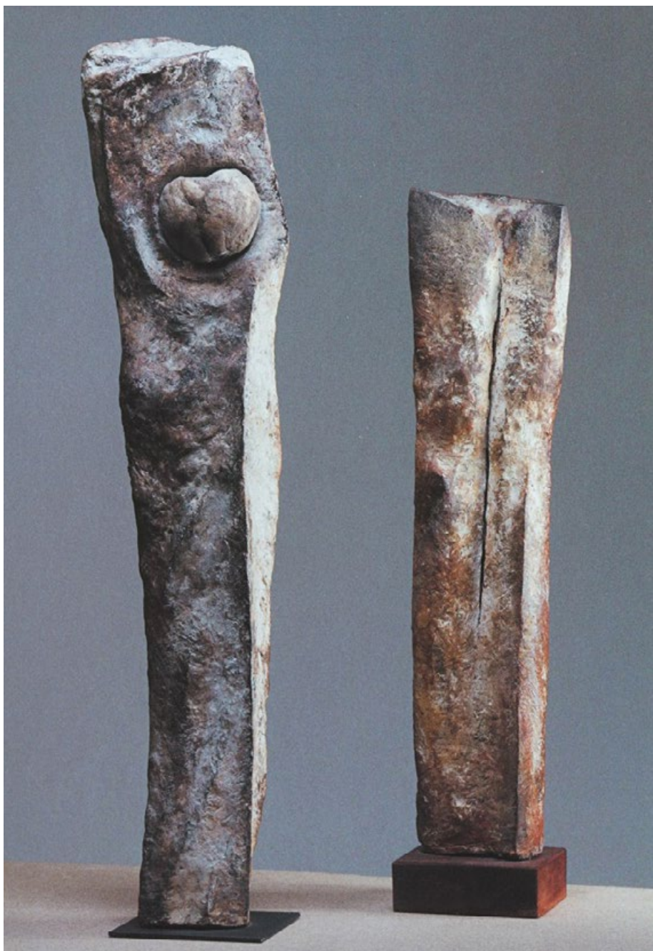
Z cyklu Oblázky - balvany a z cyklu Torza, 90. léta, kamenina, v. 70 a 53 cm