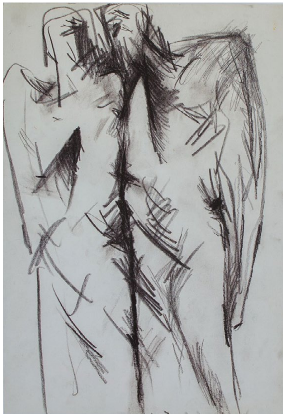
Dvě figury, kolem roku 1995, pastel, papír 42 x 30 cm