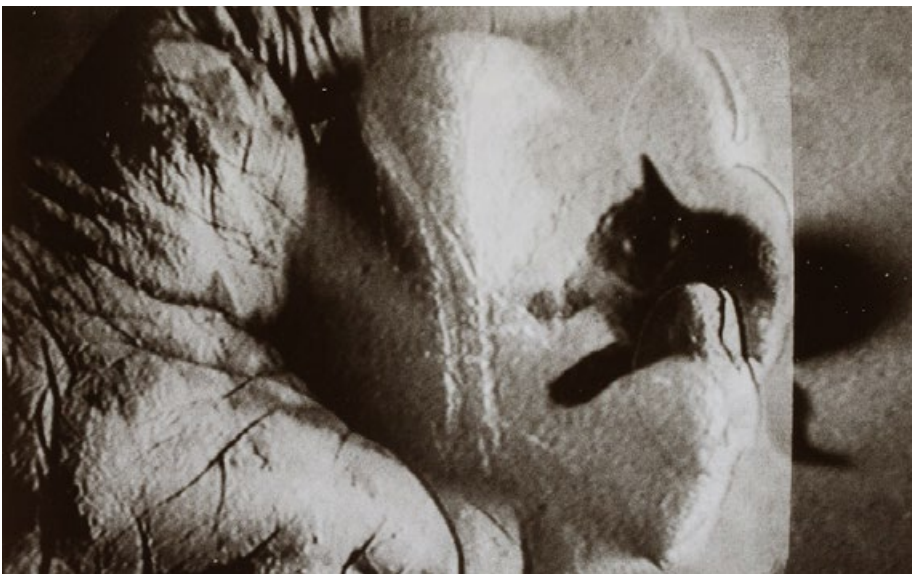
„Kocourek pod mou / dlani / se blahem svíjí - k d o podrbe naši / galaxii?“