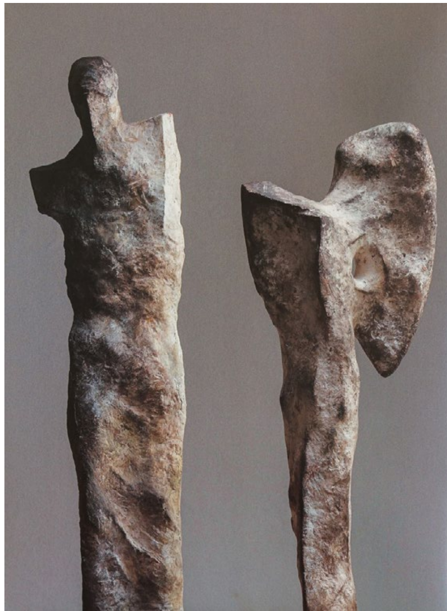
Torzo a Figura s křídlem, 2.polovina 90.let, kamenina, výšky 74 cm a 66 cm

„V mlčení větru / stín křídla / v letu na zdi. / Snad anděl / je tu?“