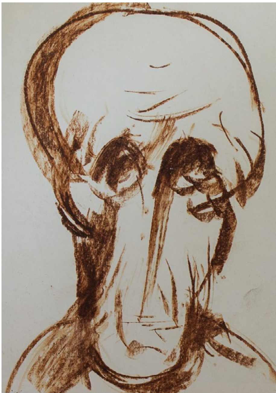
Hlava, po roce 1985, hnědý pastel, karton 33 x 24 cm