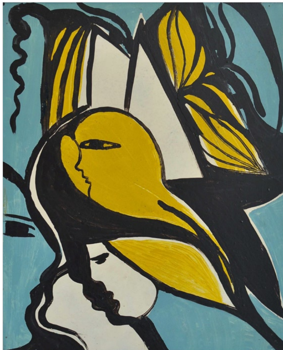
Z cyklu „Ty a já“, 1972, olej na sololitu, 58 x 48 cm