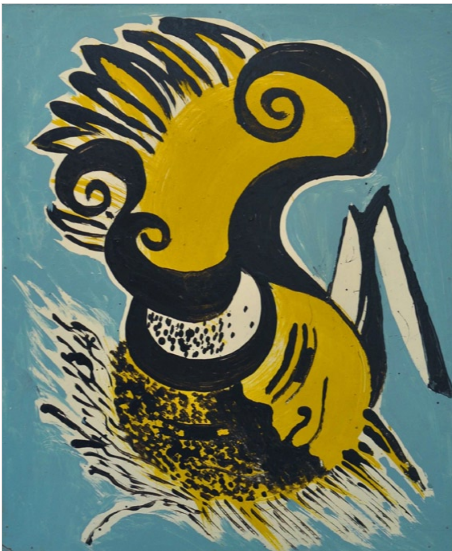
Z cyklu „Ty a já“, 1972, olej na sololitu, 58 x 48 cm