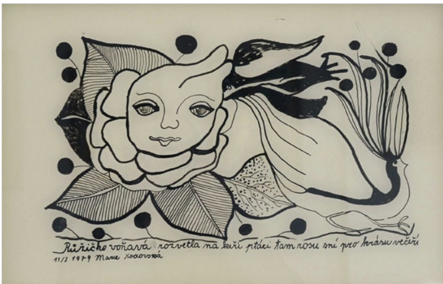
Růžička voňavá rozkvétla na keři ptáci tam rosu sní pro krásu večeri 11. 3. 1979, tuš na skle, 30 x 46 cm