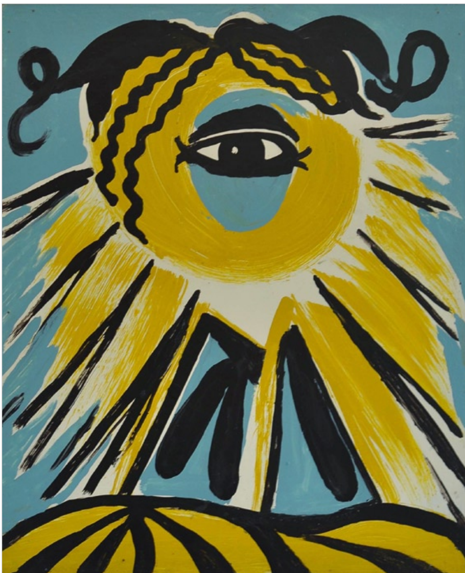
Z cyklu „Ty a já“, 1972, olej na sololitu, 58 x 48 cm