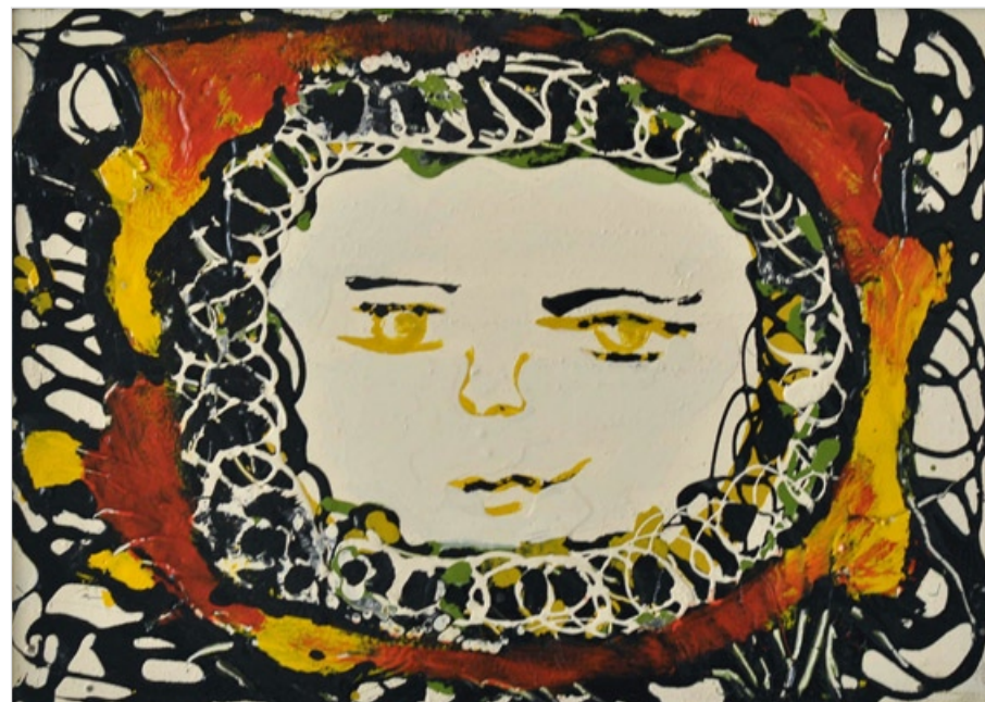
Slunce I, nedatováno, olej na sololitu, 22 x 32 cm

www.galerie-sumperk.cz / www.dksumperk.cz