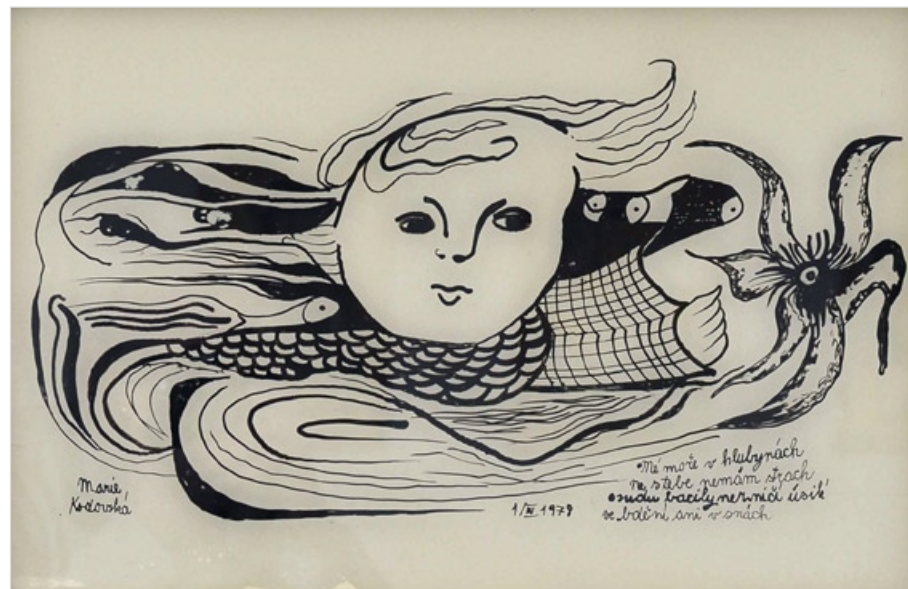
tuš na skle, 30 x 46 cm

Mé moře v hlubinách ne z tebe nemám strach osudu bacily nezničí úsilí ve bdění ani v snách