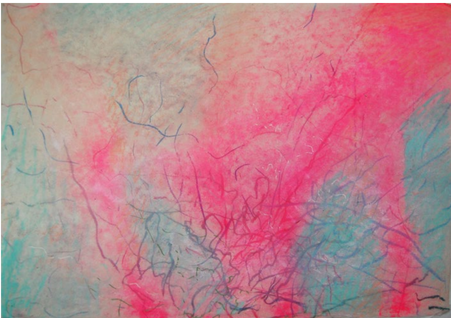
2012, kombinovaná technika na ručním papíře, 57 x 80 cm