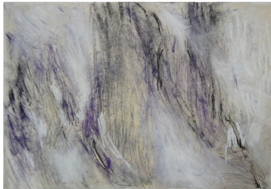
2012, kombinovaná technika na ručním papíře, 57 x 80 cm

Někdy v roce devadesát jedna, dva nebo tři jsem malovala svůj portrét. Obraz v životní velikosti. Kráčím na něm krajinou, pestré šaty, svetr přes rameno. Je tam dům a cypřiš a dívám se divákovi do očí. Tenhle obraz byl asi okamžikem přerodu. Pořád jsem ho přemalovávala. Najednou mi začala vadit moje realistická podoba. Chtěla jsem zachytit pocit volnosti, ne malovat obraz o sobě. A věrná podoba najednou rušila. Takže nakonec je tam postava zcela bez konkrétních rysů, taková jakási pramáti Eva na počátku civilizace. To byla míra zobecnění, již jsem byla tehdy schopna. Pak to šlo dál, figura se začala spojovat s krajinou. Najednou mě fascinovalo, že se figurální motivy objevují ve skalách, ve stromech. Krajiny, kde jste objevili třeba nohu nebo ženský akt. Zobecnování šlo ještě dál. Je to nejsvobodnější forma výtvarné řeči, v níž hovoří barva a tvar.