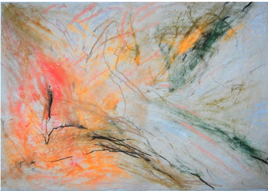
2012, kombinovaná technika na ručním papíře, 57 x 80 cm

Někdy v roce devadesát jedna, dva nebo tři jsem malovala svůj portrét. Obraz v životní velikosti. Kráčím na něm krajinou, pestré šaty, svetr přes rameno. Je tam dům a cypřiš a dívám se divákovi do očí. Tenhle obraz byl asi okamžikem přerodu. Pořád jsem ho přemalovávala. Najednou mi začala vadit moje realistická podoba. Chtěla jsem zachytit pocit volnosti, ne malovat obraz o sobě. A věrná podoba najednou rušila. Takže nakonec je tam postava zcela bez konkrétních rysů, taková jakási pramáti Eva na počátku civilizace. To byla míra zobecnění, již jsem byla tehdy schopna. Pak to šlo dál, figura se začala spojovat s krajinou. Najednou mě fascinovalo, že se figurální motivy objevují ve skalách, ve stromech. Krajiny, kde jste objevili třeba nohu nebo ženský akt. Zobecnování šlo ještě dál. Je to nejsvobodnější forma výtvarné řeči, v níž hovoří barva a tvar.