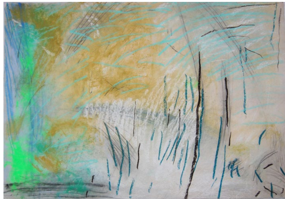
2012, kombinovaná technika na ručním papíře, 57 x 80 cm

Výtvarné vyjadřování je přirozenou součástí mého života, je to pro mne jedinečný prostředek sebereflexe a následně i křehké mimoslovní komunikace s okolním světem. Tvoření vnímám jako tajemnou třináctou komnatu, v níž se dějí nepopsatelné věci, ale vycházím z té komnaty vždy znovu něčím obdarována, snad nejvíce pocitem smysluplnosti vlastní existence.