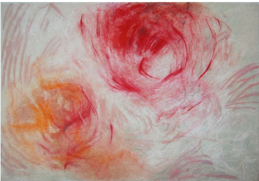
2012, kombinovaná technika na ručním papíře, 57 x 80 cm