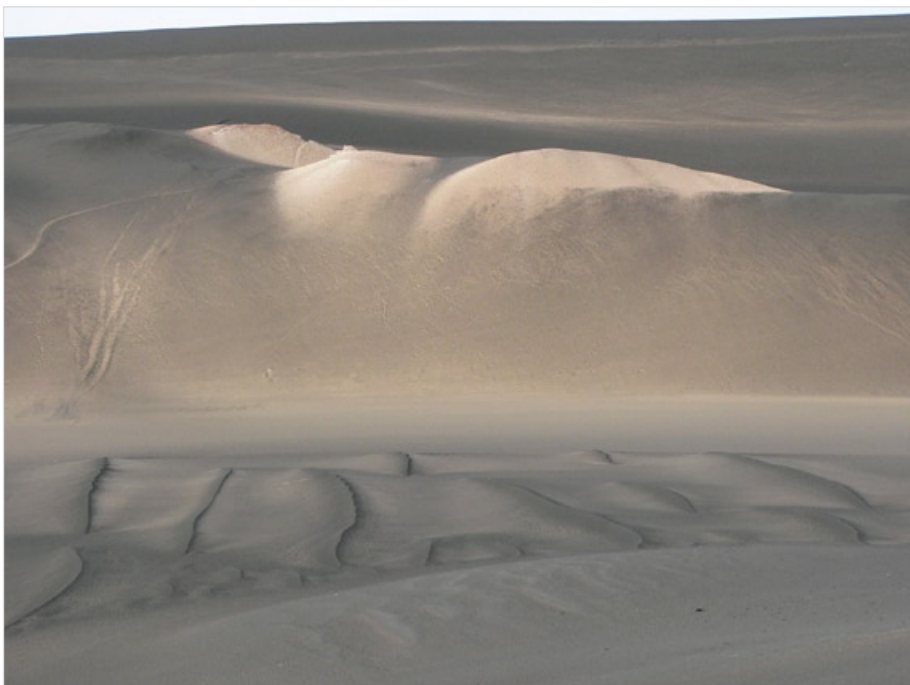
Waw an Nanus, Libye, 2009