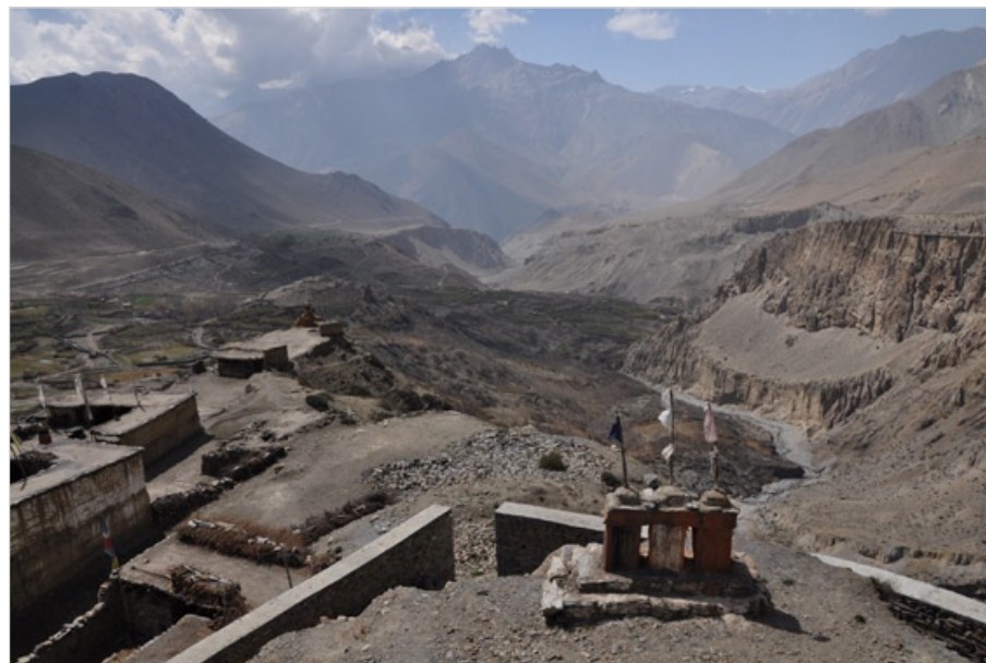
Nepál, Mustang, 2010