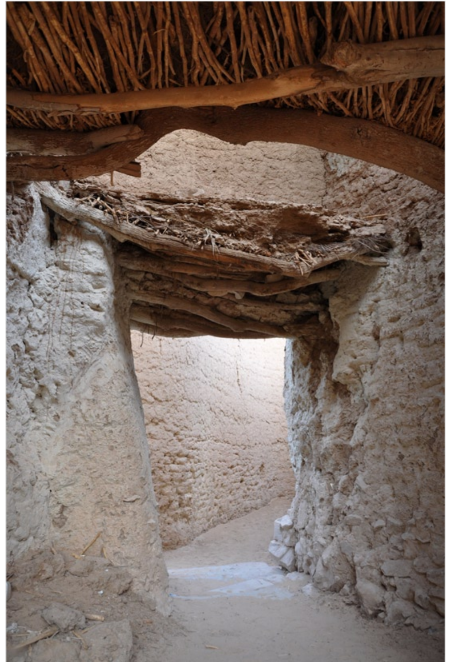
Ghat, Libye, 2009