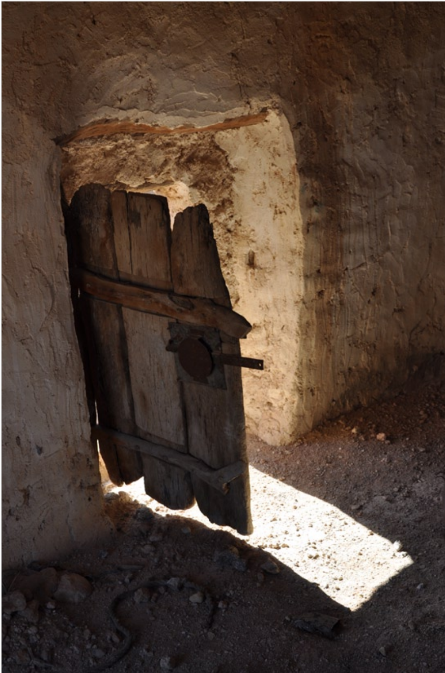
Kabav, Libye, 2009