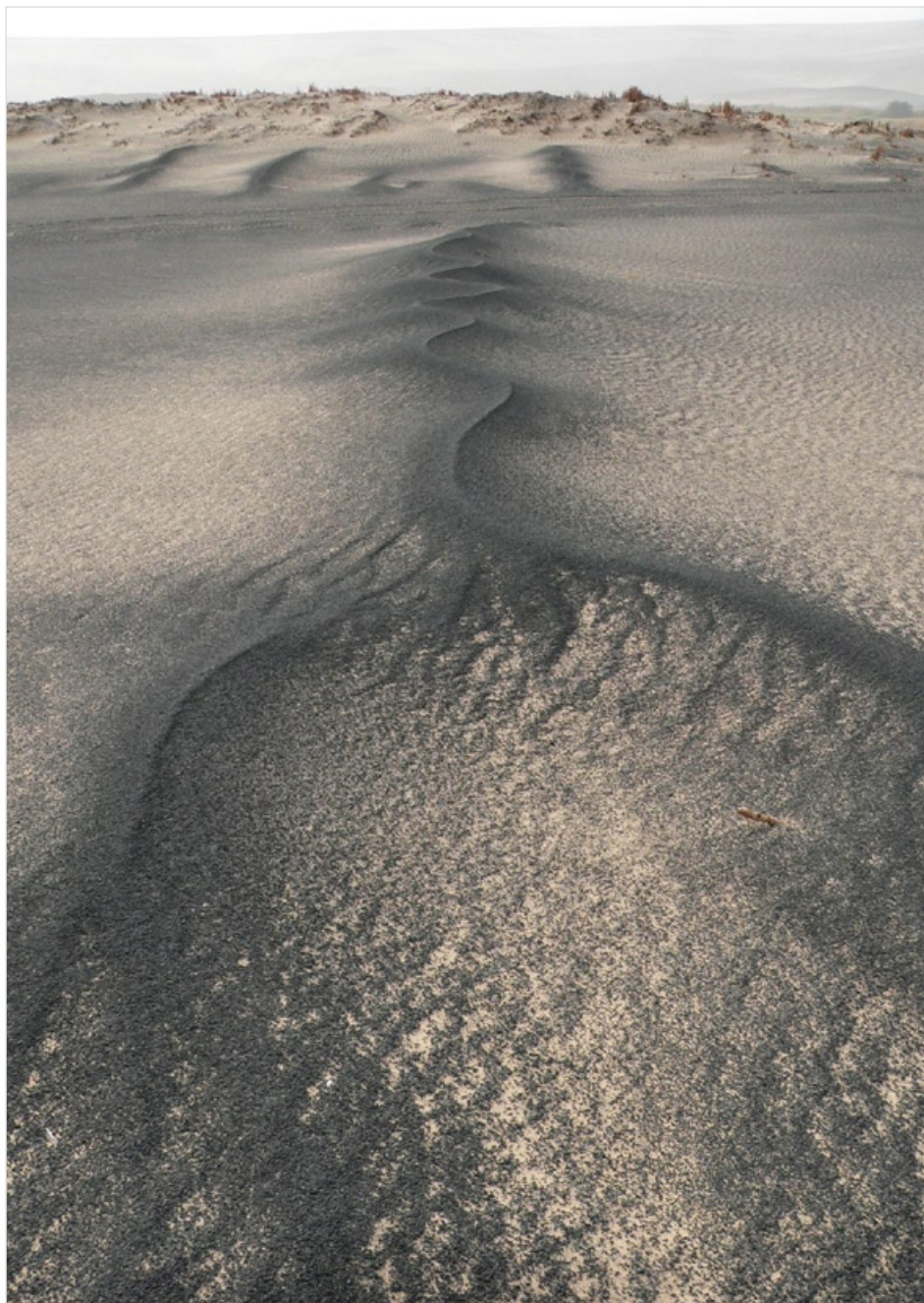
Černé písky Libye, 2007