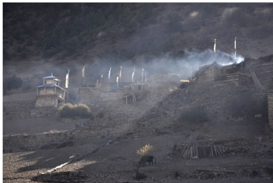
Ranní obětní kouř nad Pisangem, Nepál, 2010