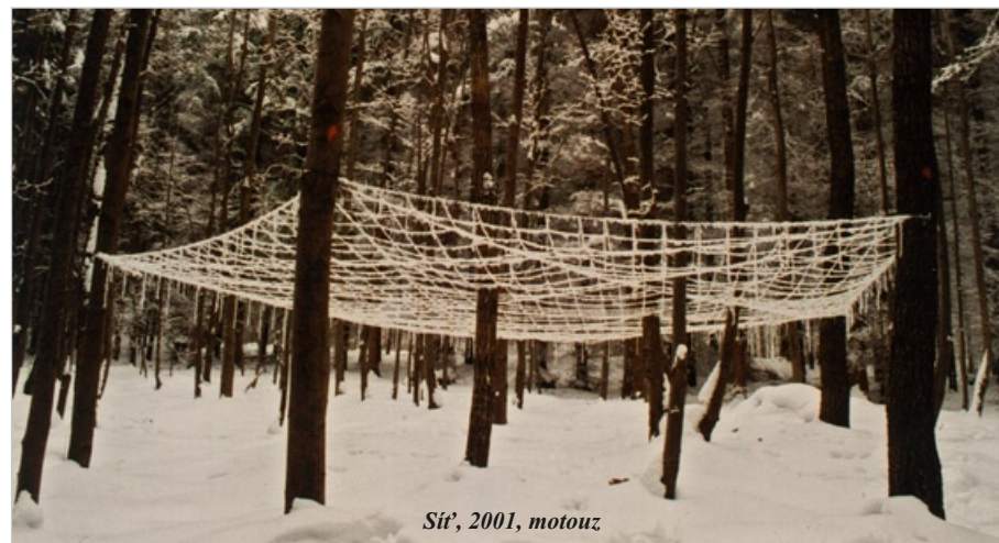
Sít', 2001, motouz

Pokouším se vycházet z prostoru a materiálu. Většina mých prací jsou instalace a přesto vlastně i sochy. Zajímá mě jejich vnitřní prostor, chci, aby diváci do něho vstupovali. Aby se stali jeho součástí a měli celkový, ne pouze vizuální zážitek.