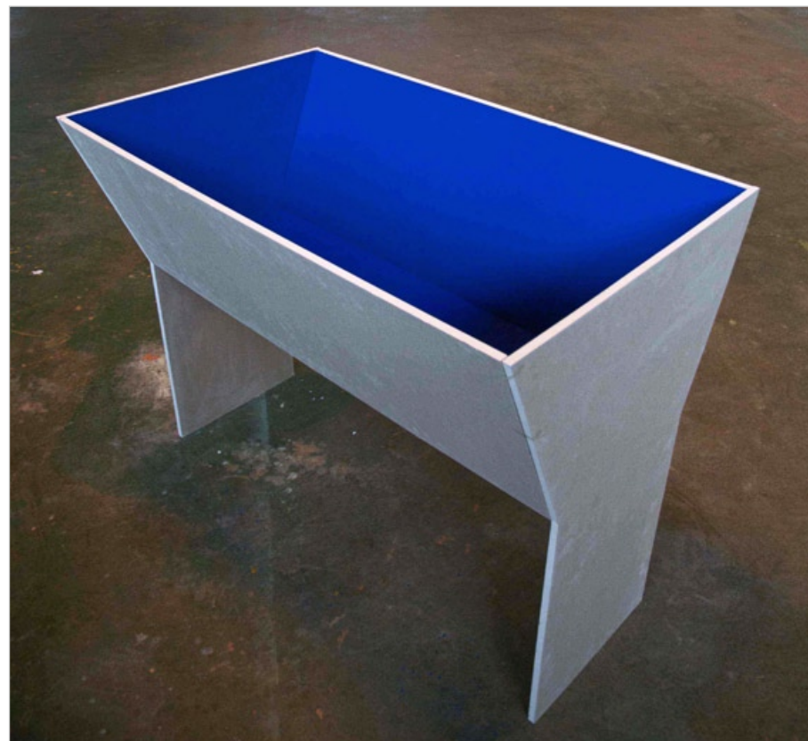
Kolébka, 2008, sádrokarton, modrý pigment, součást instalace