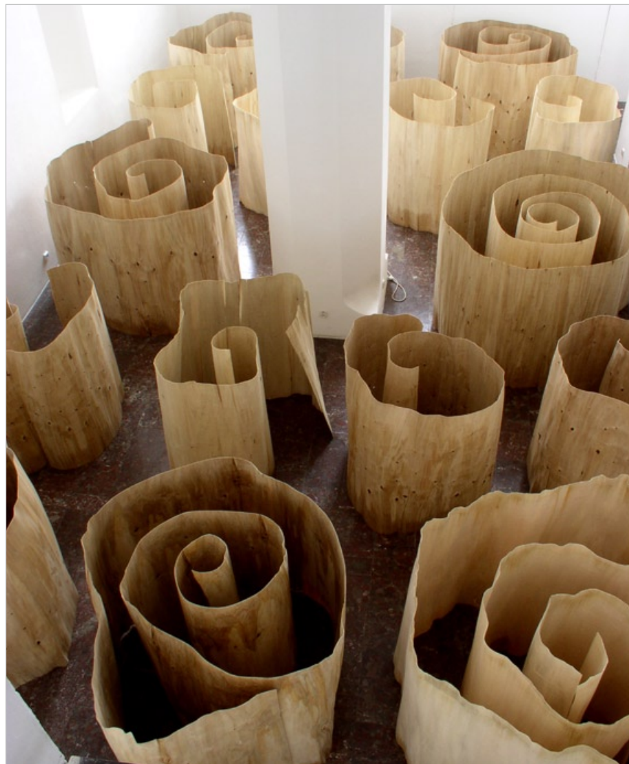
Dýha I, 2004