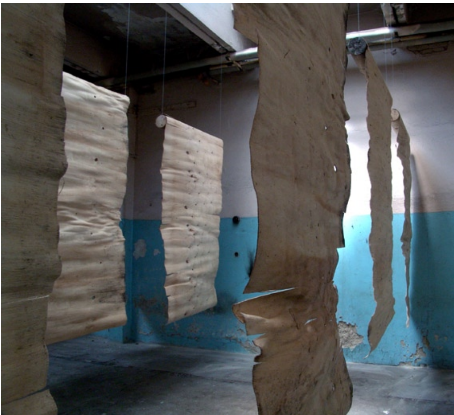
Dýha 3, 2005, dýhy a dřevo, Zbrojovka Brno