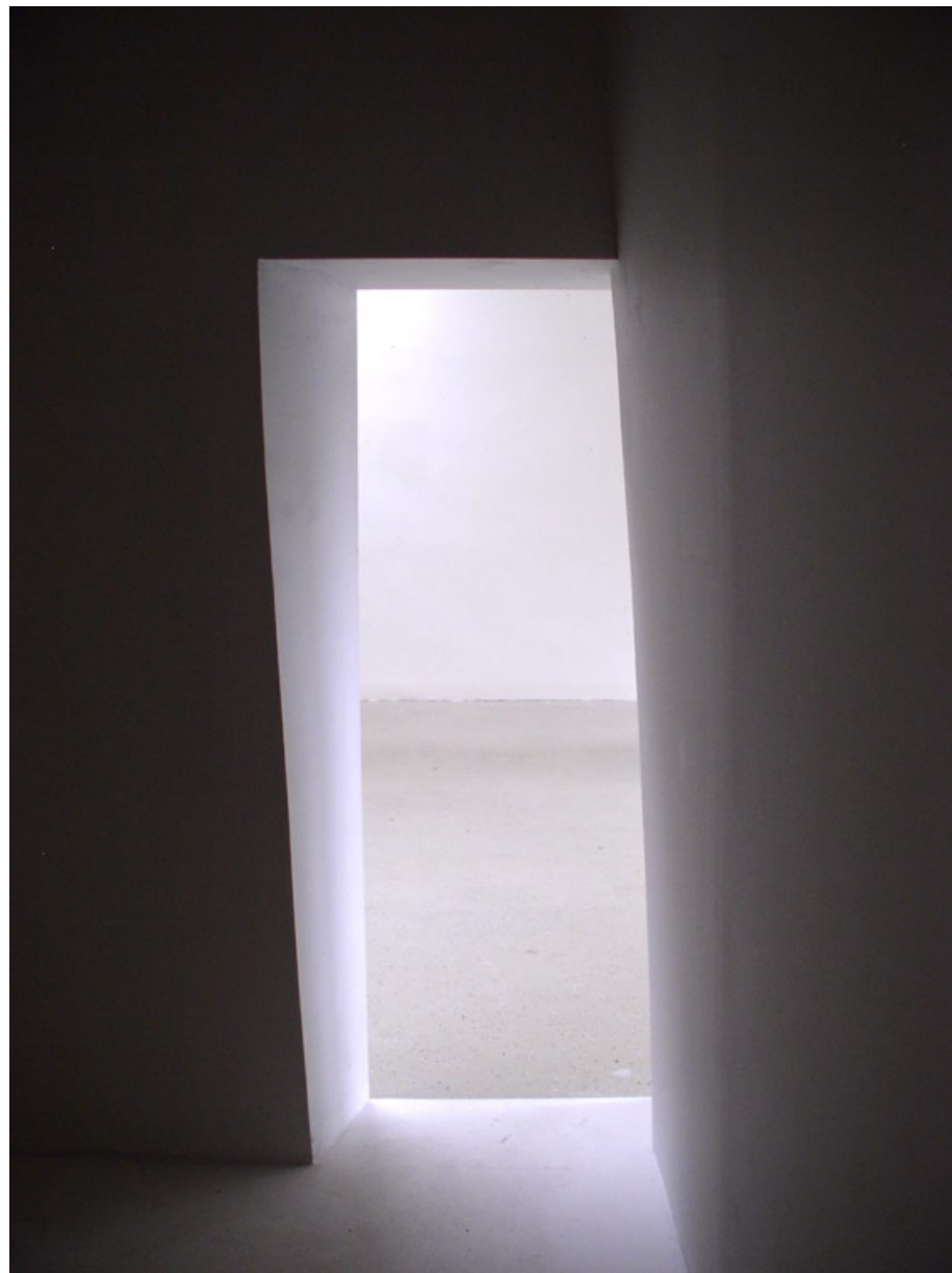
Bílá krychle, 2006, sádrokarton, pohled zevnitř