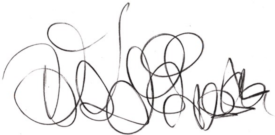
skripturální kresba vícebarevnou tužkou, 29,7 x 21 cm, 2003