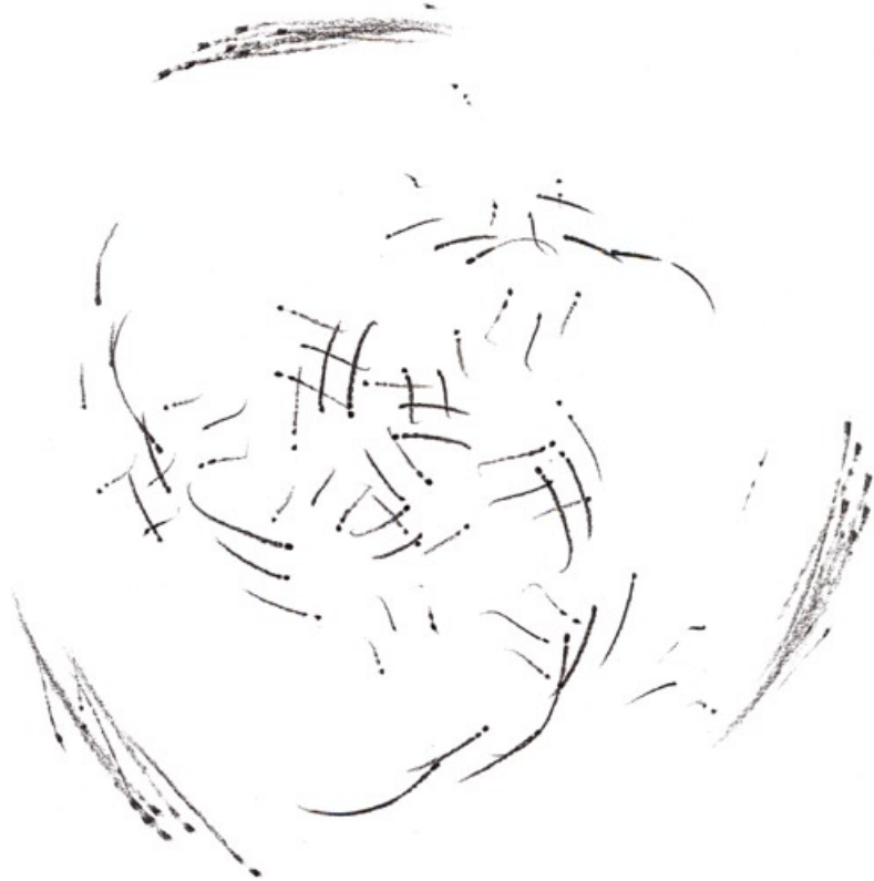
cirkulární kresba, tužka na papíře, 29,7 x 21 cm, 2001