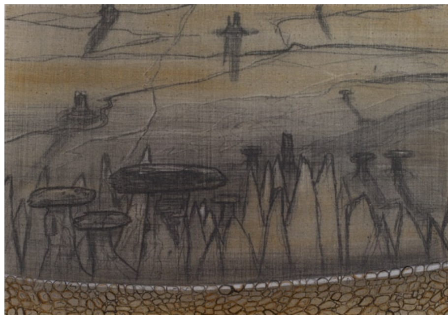
„Údolí Boží“, Utah 2006, tužka a pastel, 39 x 55,5 cm

Proto Pane vytrhni mne z mých rukou Poutal jsem se řetězy svých omylů přikován ke svým vášním poplenil co dobrého v srdci jsi zasal Rozházal Tvé