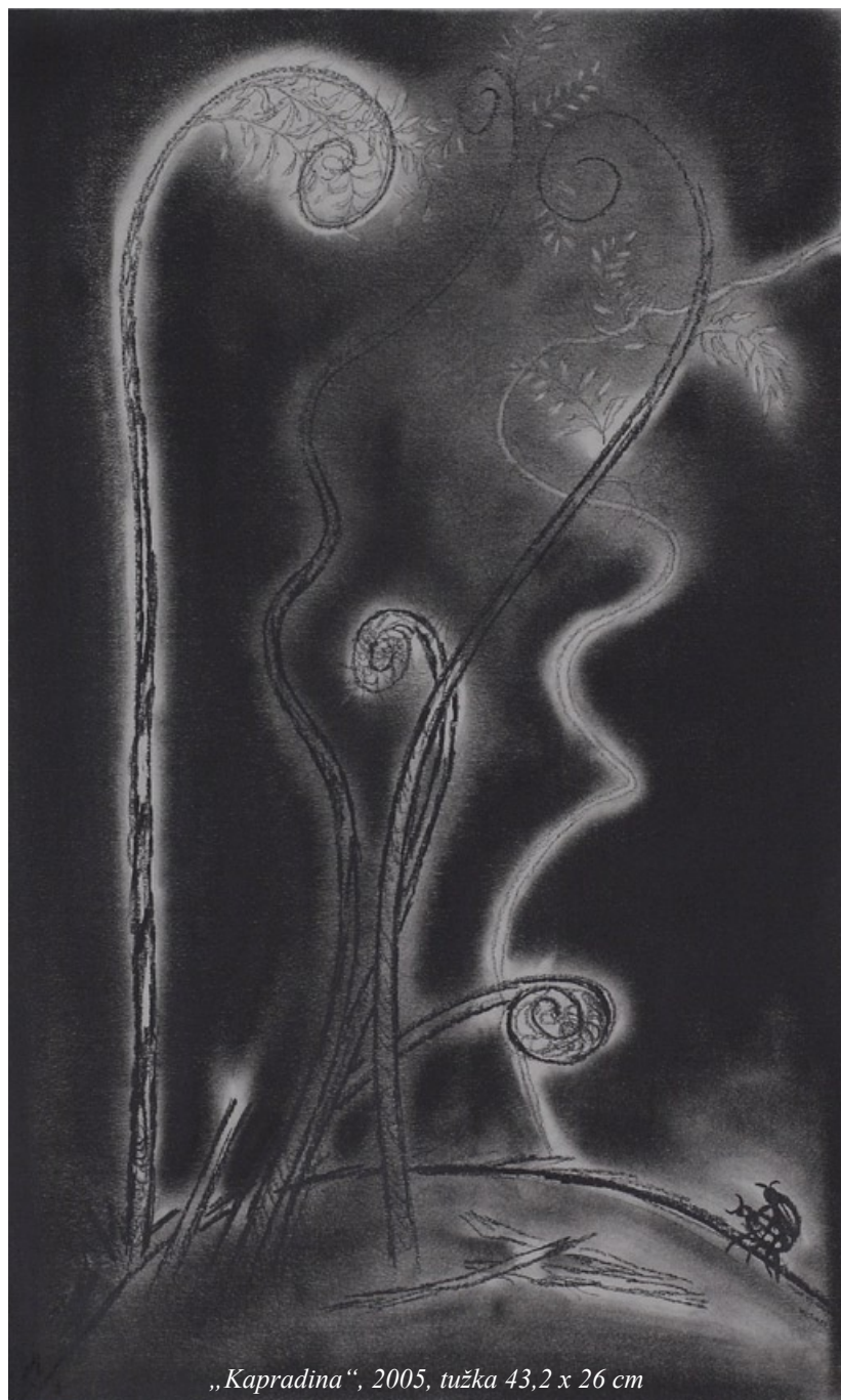
„Kapradina“, 2005, tužka 43,2 x 26 cm