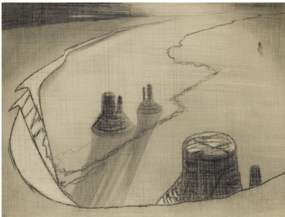
„Údolí Boží“, Utah 2006, tužka, 43,6 x 57,6 cm