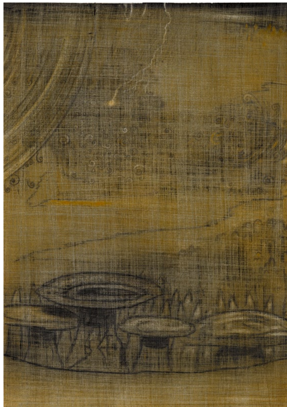
„Údolí Boží“, Utah 2006, tužka a pastel, 55,2 x 39 cm