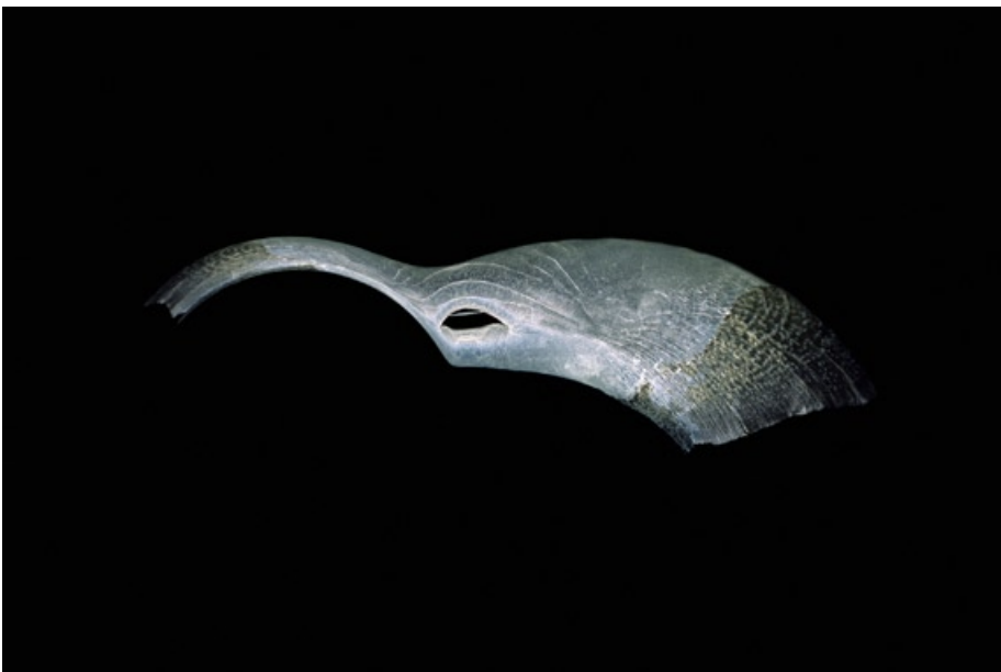
rybí šupina z cyklu „Okamžik“, 1997 – 2007, fotografický papír