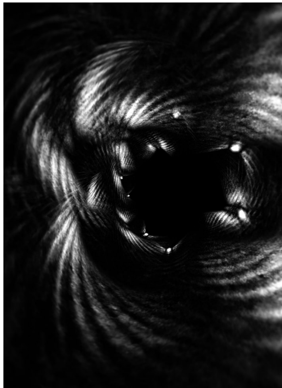
kůže prstů z cyklu „Okamžik“, 1997 – 2007, fotografický papír