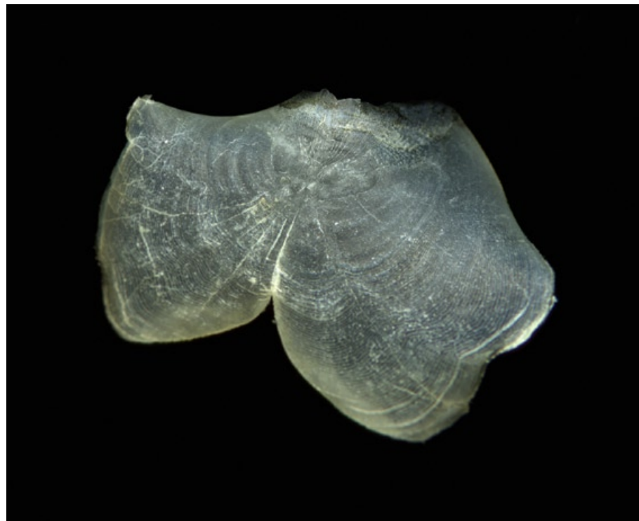
rybí šupina z cyklu „Okamžik“, 1997 – 2007, fotografický papír